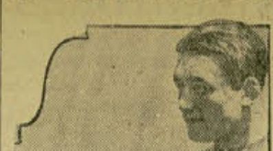
André Routis, el actual campeón mundial del peso pluma.

Se mantuvo tan cerca del curso del río, que se creía que la visibilidad era tan pobre que los tripulantes del dirigible no podrían ver otros lugares que les orientasen con más facilidad, ayudándoles a reducir el número de millas recorridas.