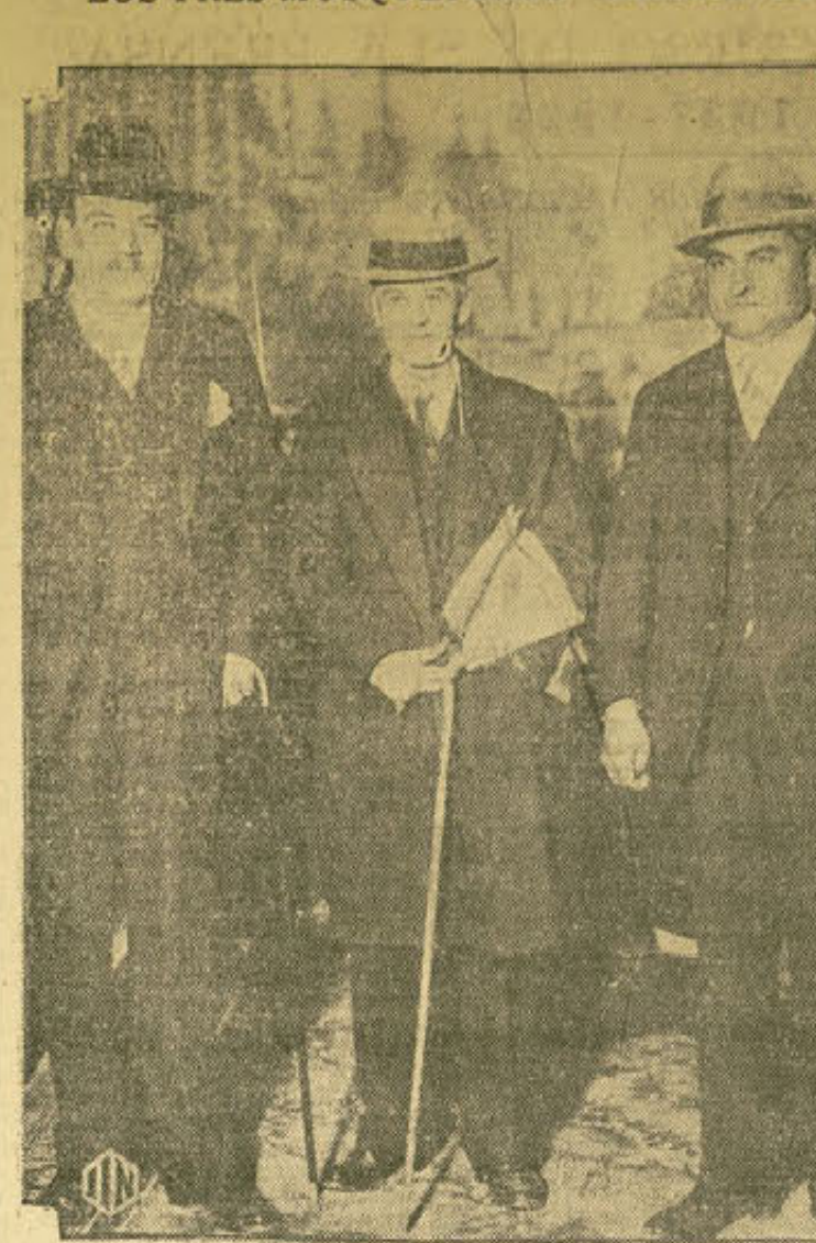
De izquierda a derecha, aparecen en esta admirable fotografía tres de los más prominentes personajes en la vida pública de Méjico. El presidente Calles, el embajador de los Estados Unidos Mr. Morrow y el nuevo presidente electo señor Portes Gil.