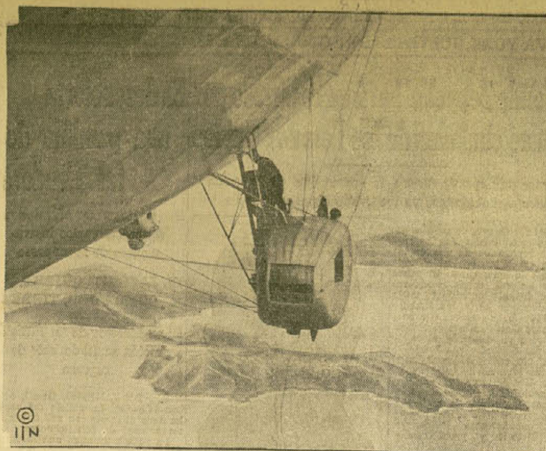
Curiosa vista de las islas Madeira, tomada desde una de las barquillas del "Conde Zeppelin" durante su épico vuelo desde Alemania a los Estados Unidos.