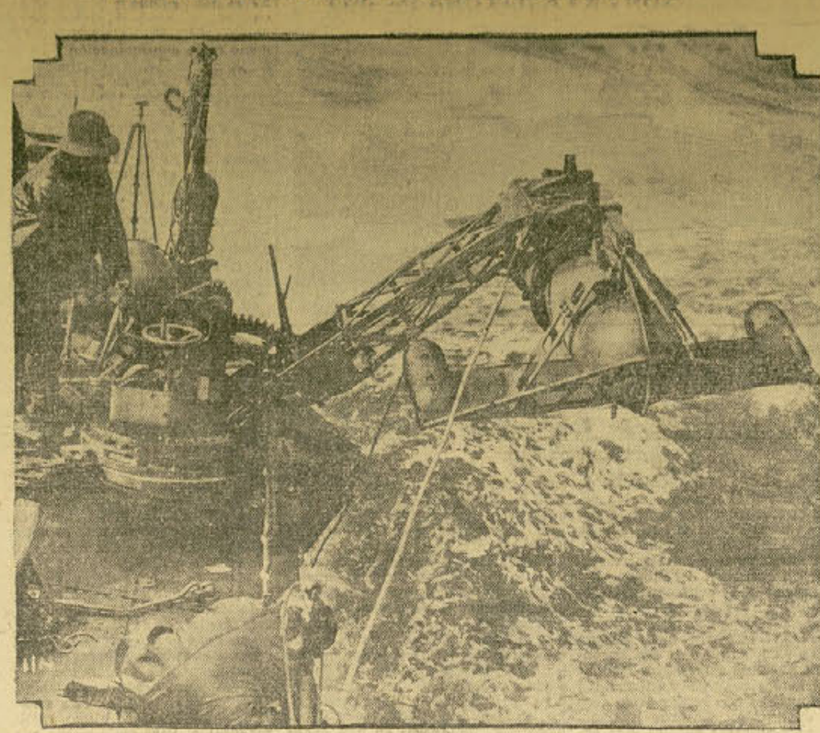
Esta interesante fotografía fué tomada en el momento en que se lanzaba al agua un aparato barrer-minas desde la cubierta del buque "Orella," uno de los seis destroyers que están siendo construidos para el gobierno chileno en astilleros británicos.

ta organizada para beneficio de la Universidad de Puerto Rico.