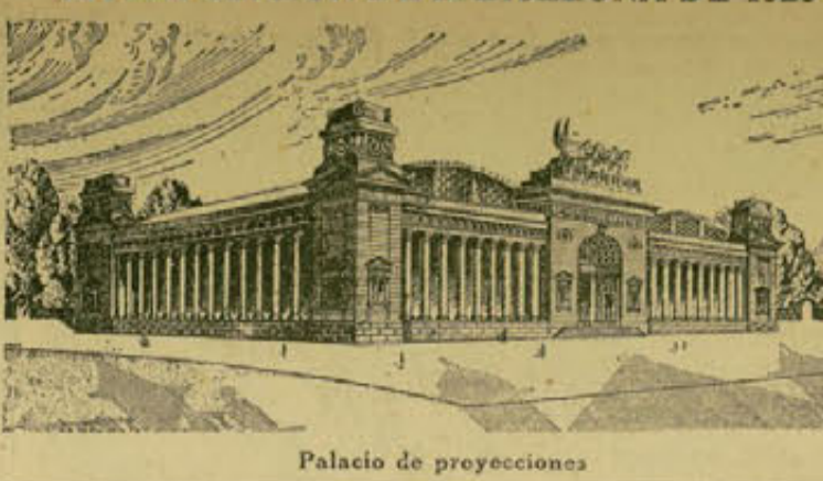
Palacio de proyecciones