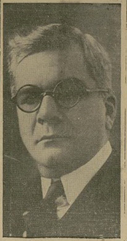
General Gerardo Machado

HABANA, octubre 31.—(P). Las elecciones presidenciales se efectuarán mañana jueves en todo el territorio insular, en un solo día, sin oposición, el general Gerardo Machado y Morales, quien, como candidato de la mayoría de los tres partidos principales busca la reelección por un periodo de seis años. En vísperas de la elección apenas si hacen comentarios políticos. No se han tomado precauciones extraordinarias, ni se han expedido órdenes especiales, la policía. Todo indica que las elecciones serán tranquilas.