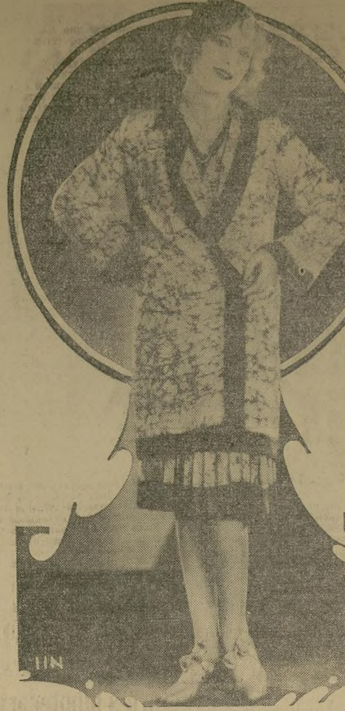
Esther Ralston es la elegante damita que se presenta a nuestras lectoras con esta bonita creación de vestido y ligero sobretodo que acaba de llegar de París.