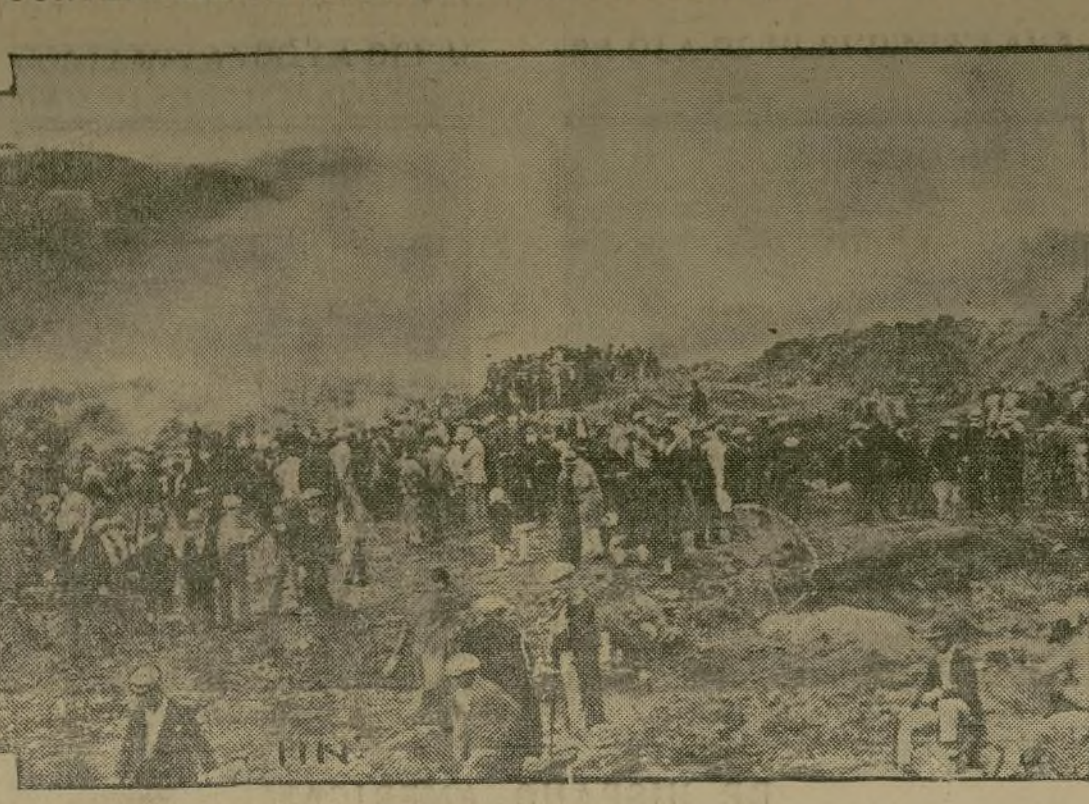
En esta fotografía aparece un grupo de vecinos del pueblo de Mascali, Sicilia, en los momentos en que contemplaba desolado la marcha devastadora de la hirviente lava arrojada por el cráter del volcán Etna.