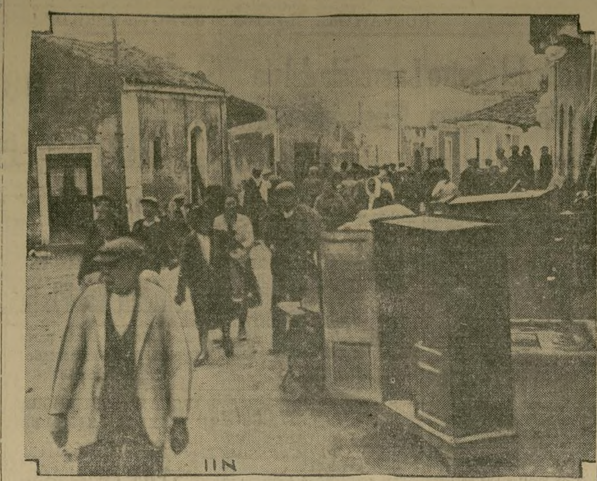
Los vecinos del pueblo de Mascali véronse forzados a abandonar el pueblo cuando la ola de lava se aproximaba lentamente, pero segura, arrastrándose por la ladera del monte Etna. El pueblo de Mascali quedó convertido en humeantes ruinas en cosa de pocas horas.