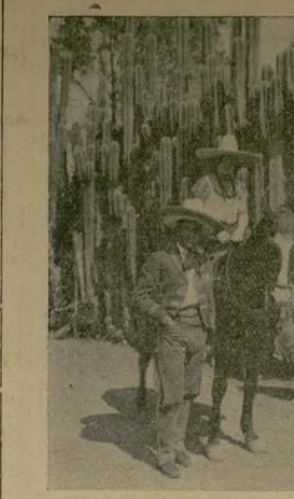
Pareja de charro y china pobлана.