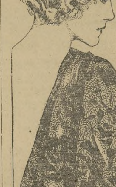
Lucille Taylor es aún más bella en persona, y si lo dudas podrás convencerte en el teatro "Ziegfeld", donde se forma parte de la compañía que representa "Show Boat".