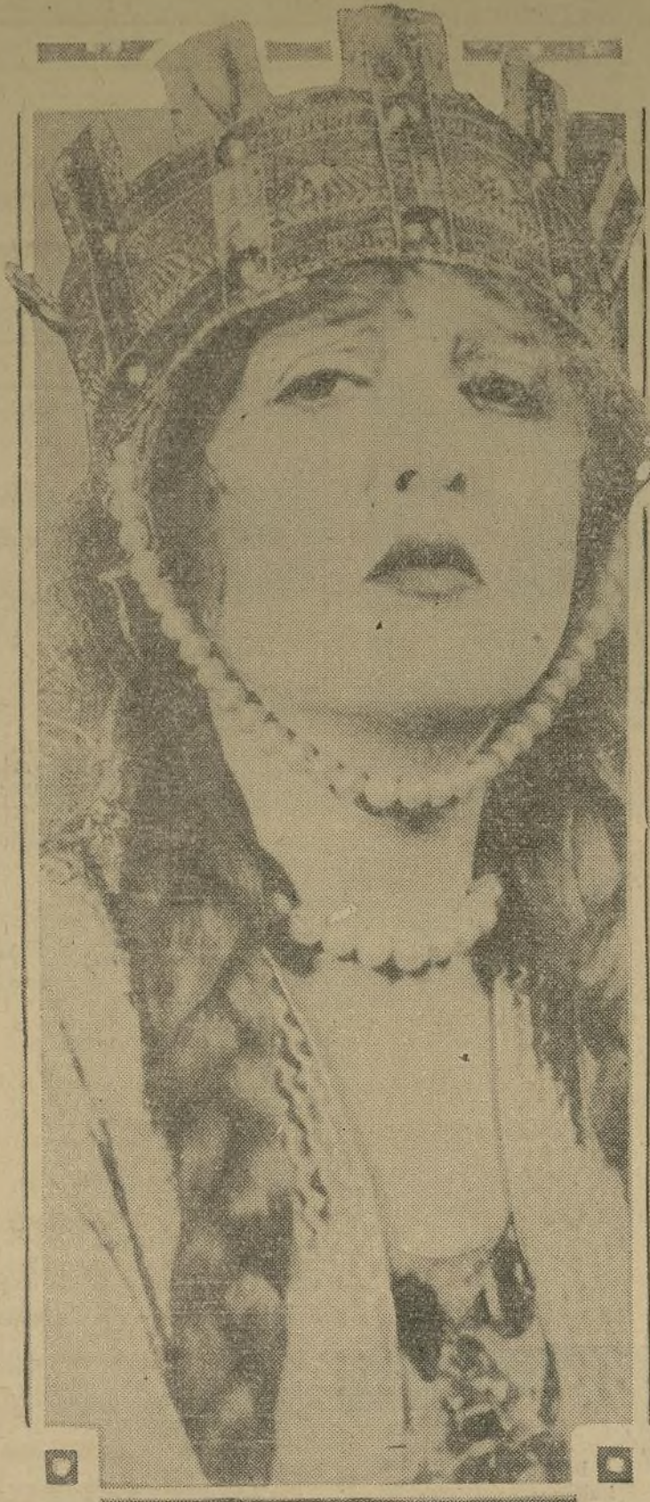
Florence Reed interpreta a la sin-estra Lady Macbeth actualmente en el teatro "Knickerbocker", donde se está representando con gran éxito la famosa obra.

Todo está listo para el estreno de "Mima", la obra de Ferenc Molnar que caerá sobre Broadway mañana por la noche. Miss Lenore Ulric se