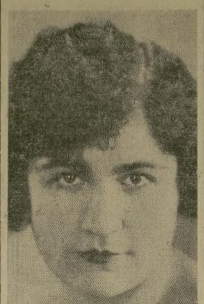
Tatiana de Sanzewitch

Ejecutada por primera vez y aplaudida con entusiasmo por una brillante concurrencia, que asistió al concierto de la notabilísima pianista Tatiana de Sanzewitch, en el Calvary Hall en la noche del viernes.