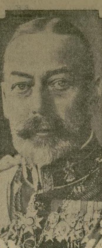
Jorge V. Rey de Inglaterra