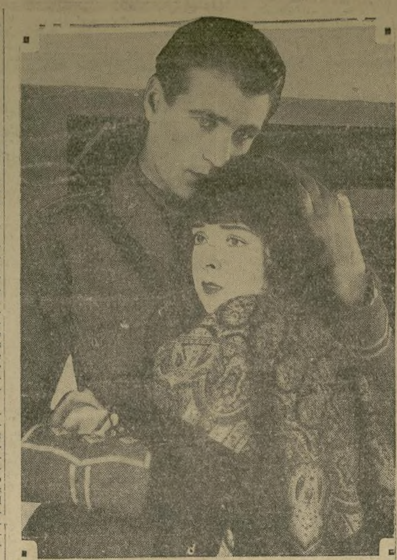
Gary Cooper, el eterno aviador, le asegura a Colleen Moore que todo saldrá bien y que con la ayuda de la Providencia volverá sano y salvo de los aires enemigos en "Lilac Time", la cinta que se está exhibiendo en el "Mack Strand".