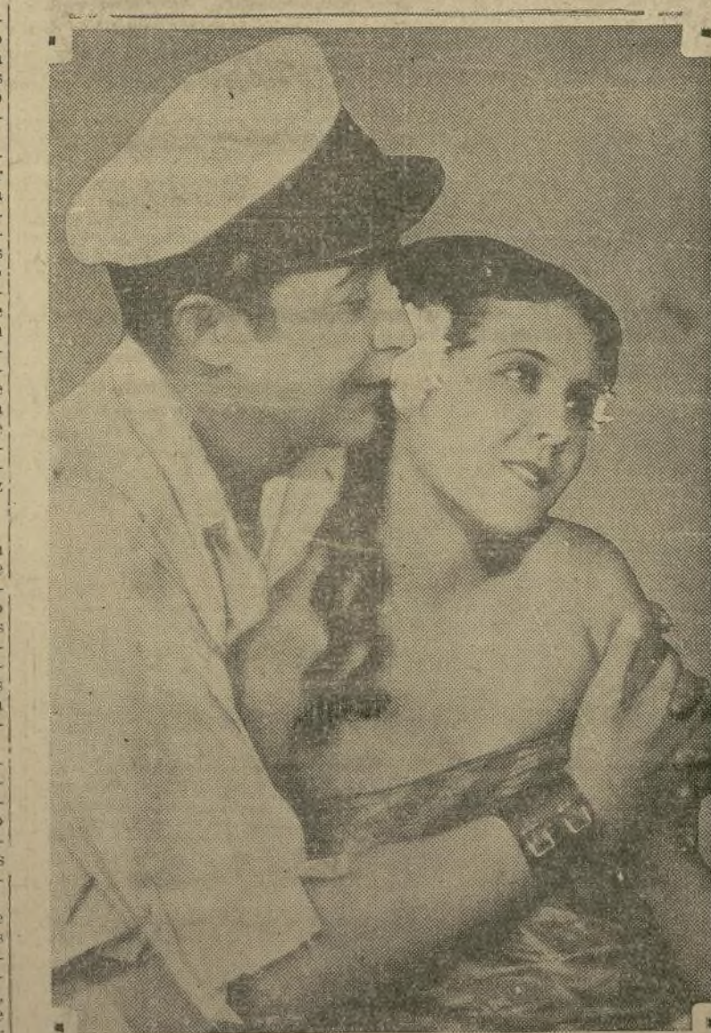
"White Shadows in the South Seas" se exhibe actualmente en el "Capitol", donde Monte Blue y Raquel Torres hacen de las suyas en una isla que se supone pertenece a las Antillas.