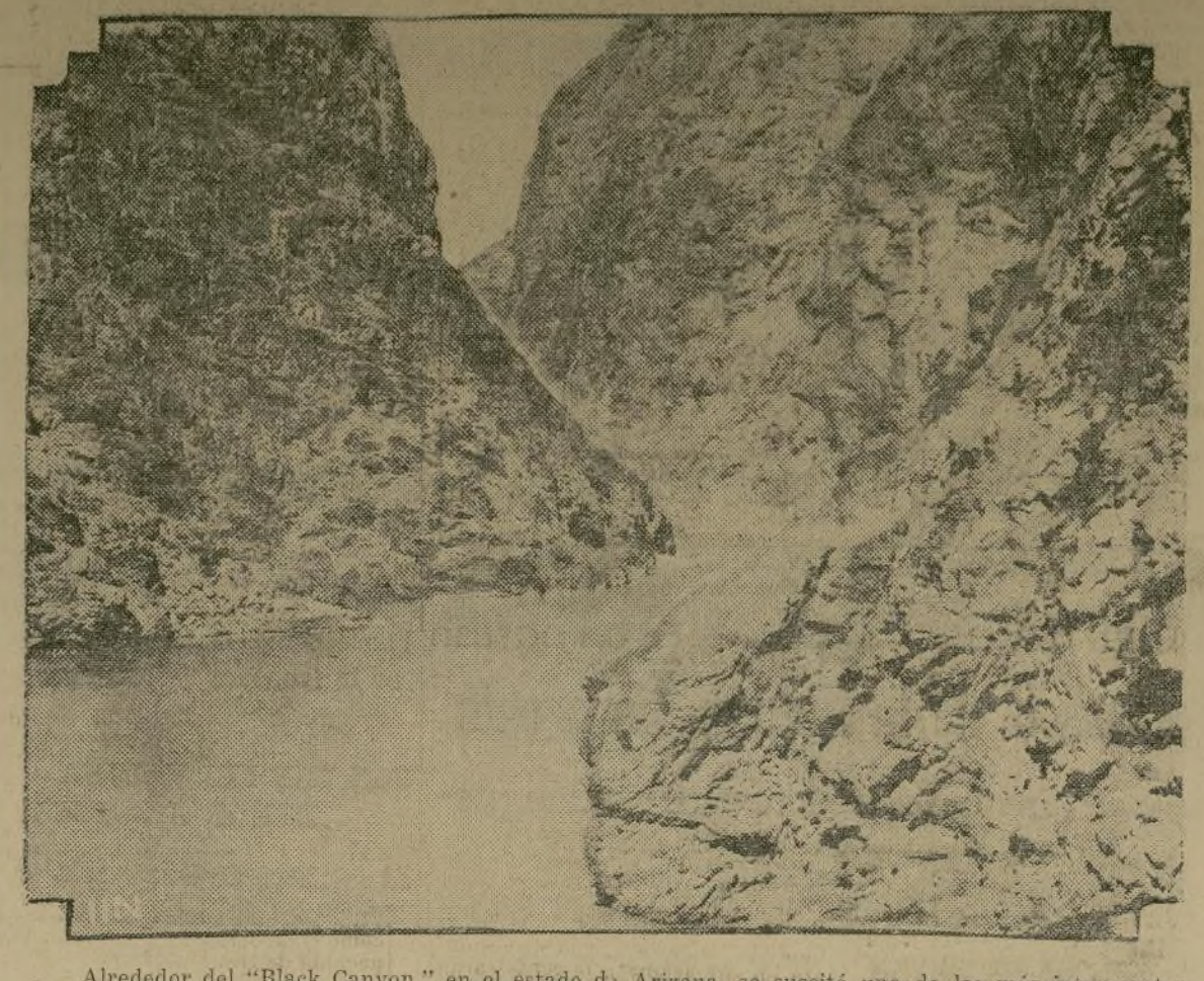
Alrededor del "Black Canyon," en el estado de Arizona, se suscitó una de las más interesantes discusiones en el congreso de los Estados Unidos, debido a que se dificultaba llegar a un acuerdo sobre las bases que han de servir para la construcción de una gran presa, la mayor del mundo. El proyecto de ley autorizando la construcción de esta represa ha sido pasada finalmente por el senado por una votación de 64 a 11, después de un debate que se extendió por espacio de siete años.

guay para solucionar pacíficamente el conflicto, declarando que la guerra conduciría únicamente a sufrimientos y sacrificios inútiles.