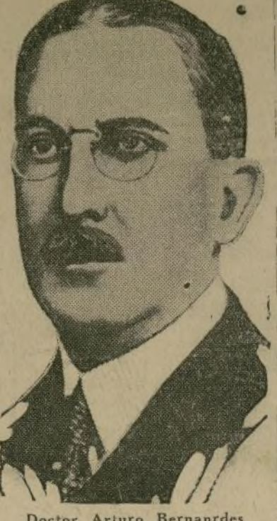
Doctor Arturo Bernardes

El gobierno y sus amigos toman medidas para contener los odios de sus adversarios