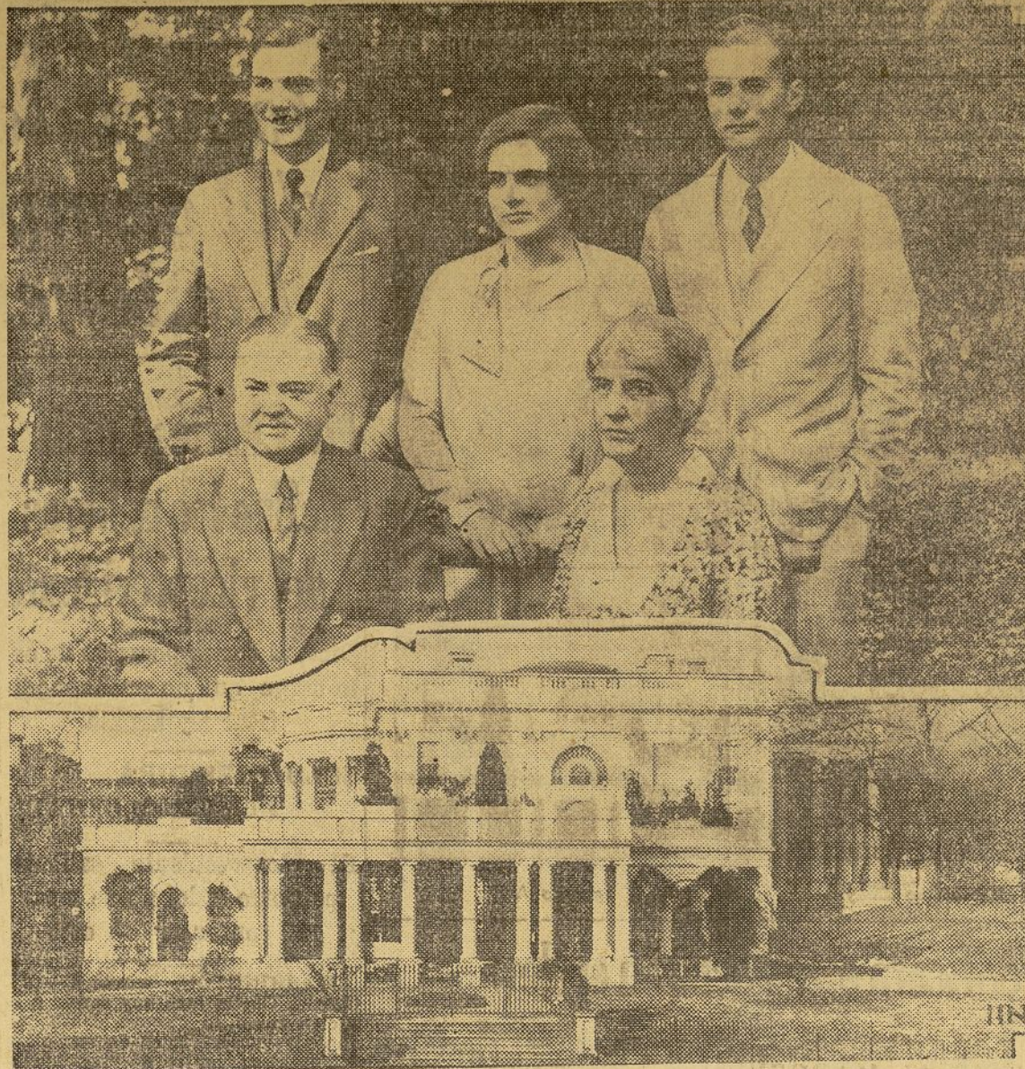
En la parte superior aparece la familia que residirá en la Casa Blanca (parte inferior) durante los próximos cuatro años, por lo menos. Sentados encuentran los esposos Mr. y Mrs. Herbert C. Hoover y de pie sus dos hijos Allan y Herbert y la esposa del segundo.