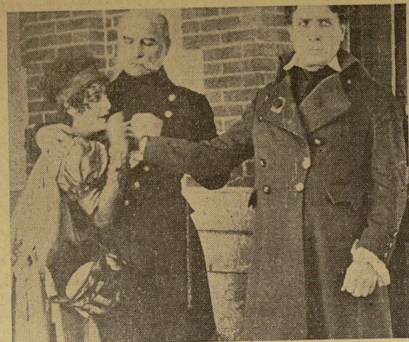
Una escena de la película "La Guardia Imperial", que se exhibe en la Bronx Opera House.

El lunes pasado fué inaugurada, bajo la gerencia de la Golden Stars Film Producing Co., Inc., la Bronx Opera House.