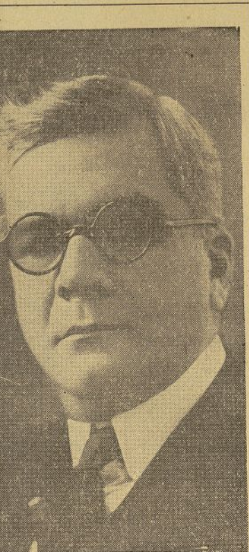
General Gerardo Machado y Morales