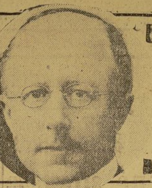
Charles Francis Adams Marina