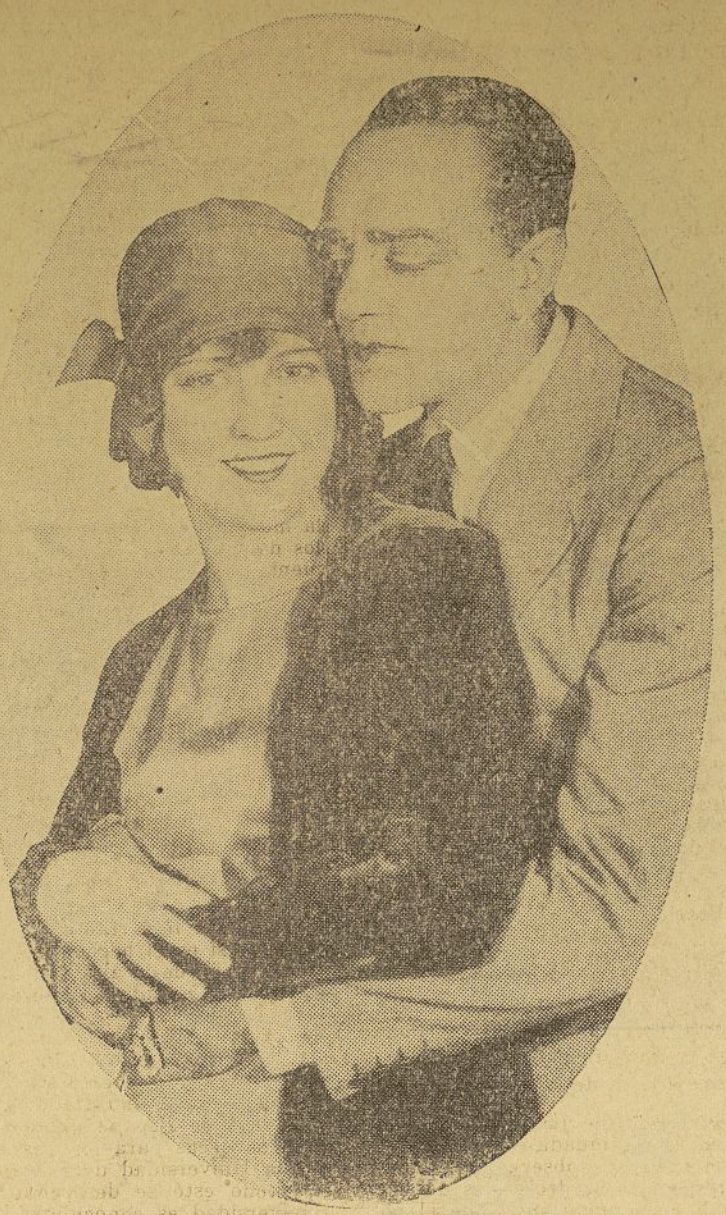
Jeanette MacDonald y Stanley Ridges, en una escena de la comedia "Boom Boom," que se representa en el teatro "Casino."