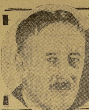
Henry Lewis Stimson Estado