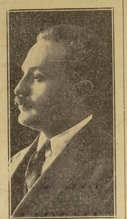
Licenciado José Vasconcelos