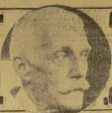
Andrew William Mellon Tesoro