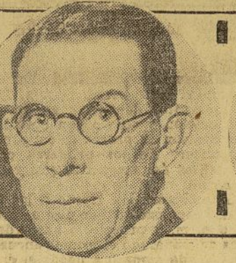
Ray Lyman Wilbur Interior