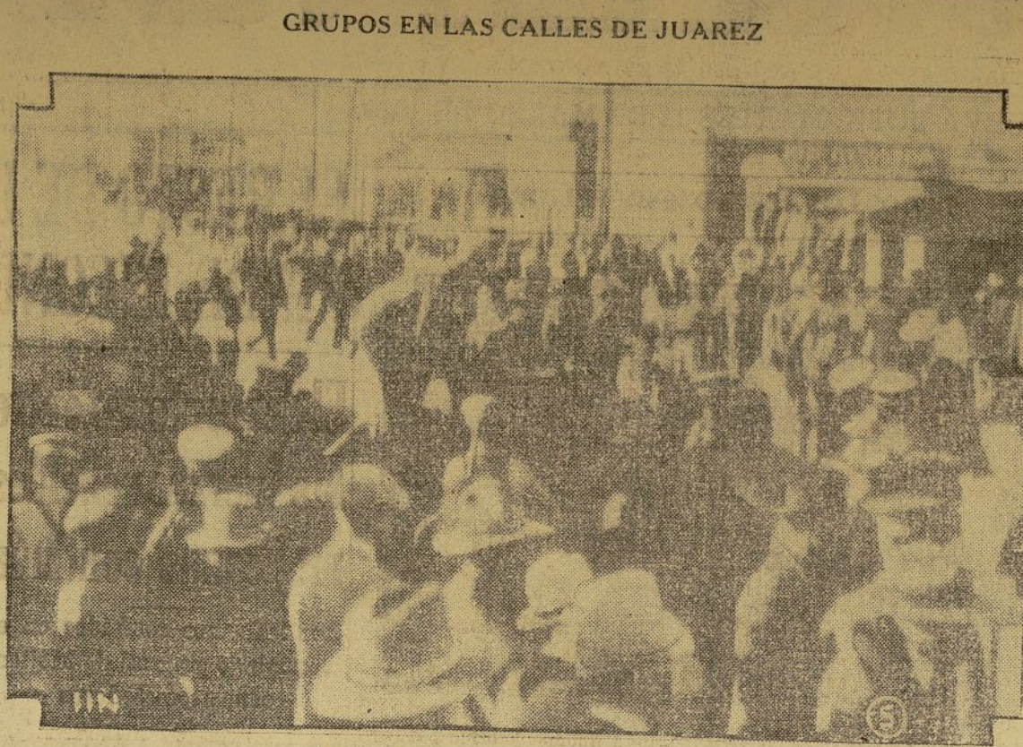
Esta fotografía fué tomada durante los últimos combates en las calles de Juárez, ciudad que cayó en poder de las fuerzas revolucionarias mejicanas.