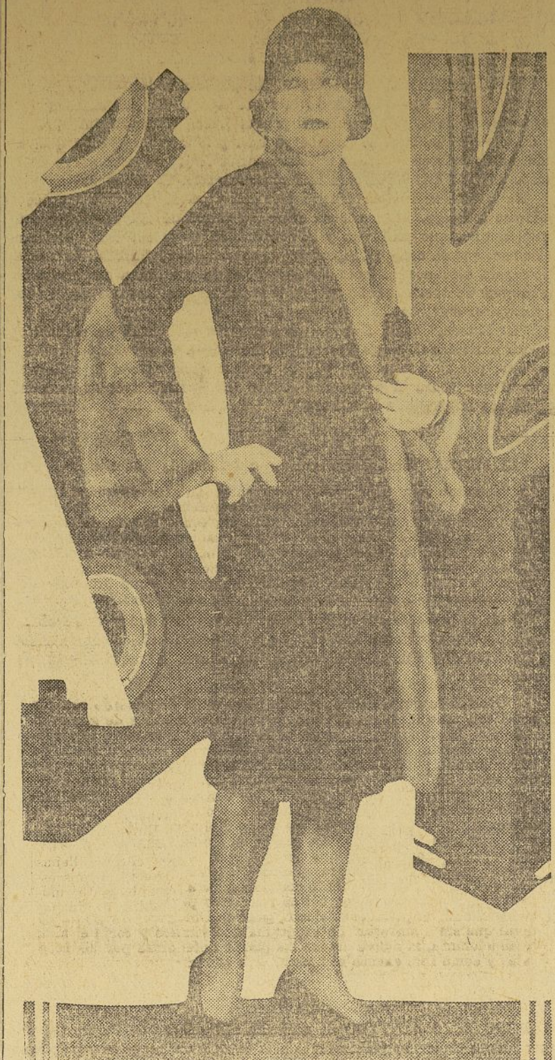
Un abrigo de hermoso paño azul marino y adornado con finísima piel de color carmelita forma un conjunto admirable, como parece desprenderse de esta fotografía. Es un tipo de gabán que promete hacer "furor" esta primavera.