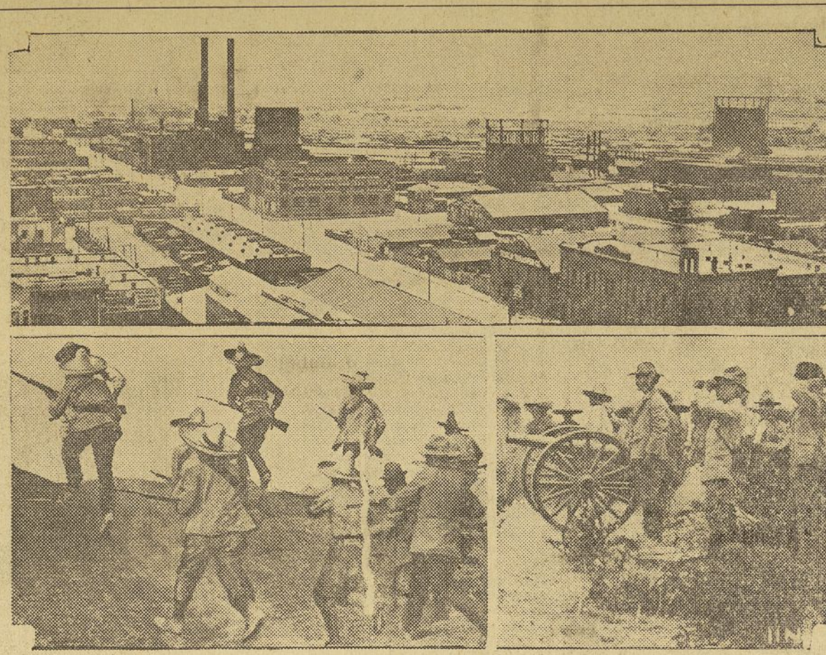
Un aspecto de ciudad Juárez, que se halla actualmente en poder de los revolucionarios mejicanos que se apoderaron de la ciudad tras una cruenta lucha