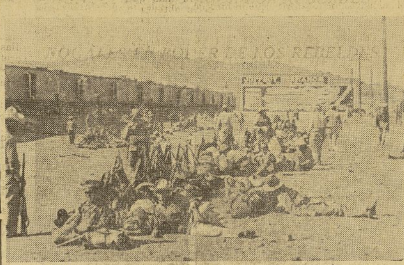
Esta fotografía ofrece una vista de un grupo de fuerzas rebeldes descansando después de haber capturado la ciudad de Nogales, en el estado de Sonora.