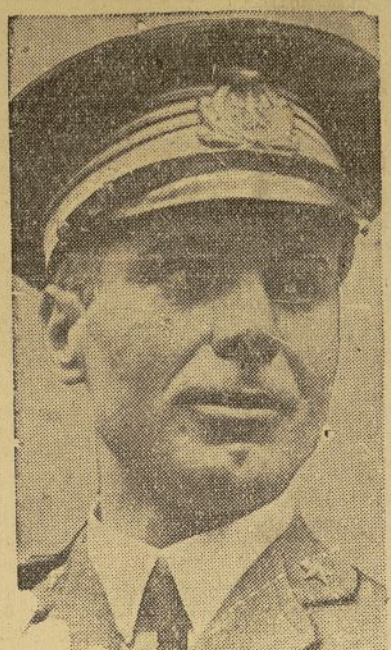
General Humberto Nobile

El general Nobile se separa de la aviación italiana