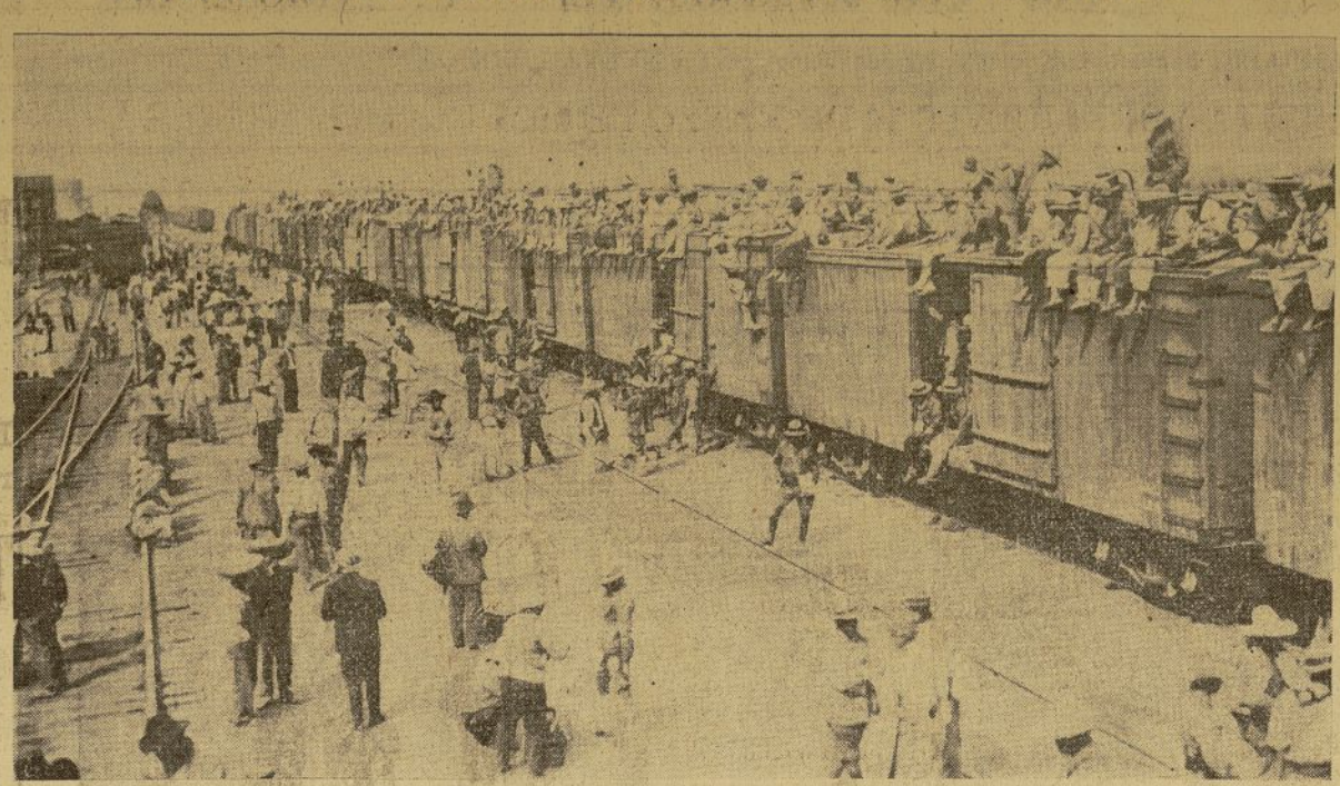
Esta fotografía presenta una descripción gráfica de las actividades militares en Méjico, donde las fuerzas federales están siendo constantemente transportadas hacia los distintos frentes de concentración de los rebeldes.