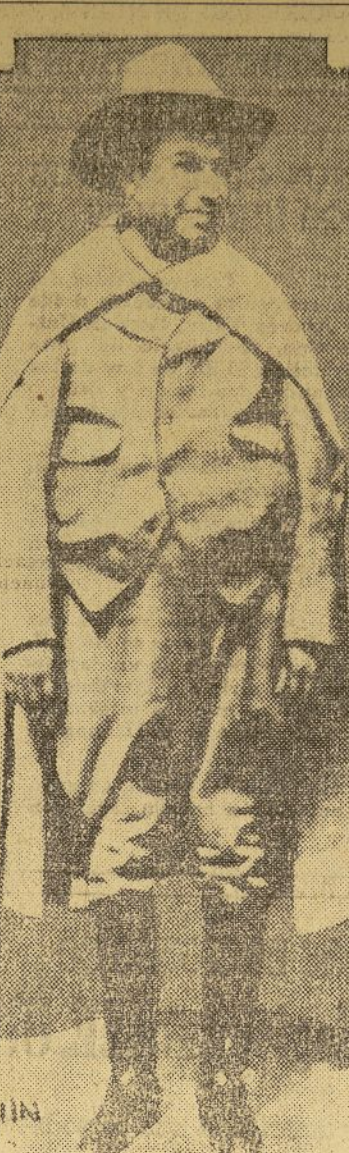
General Ramón Yucupicio

nombre de todos los jefes rebeldes, según dijo el presidente.