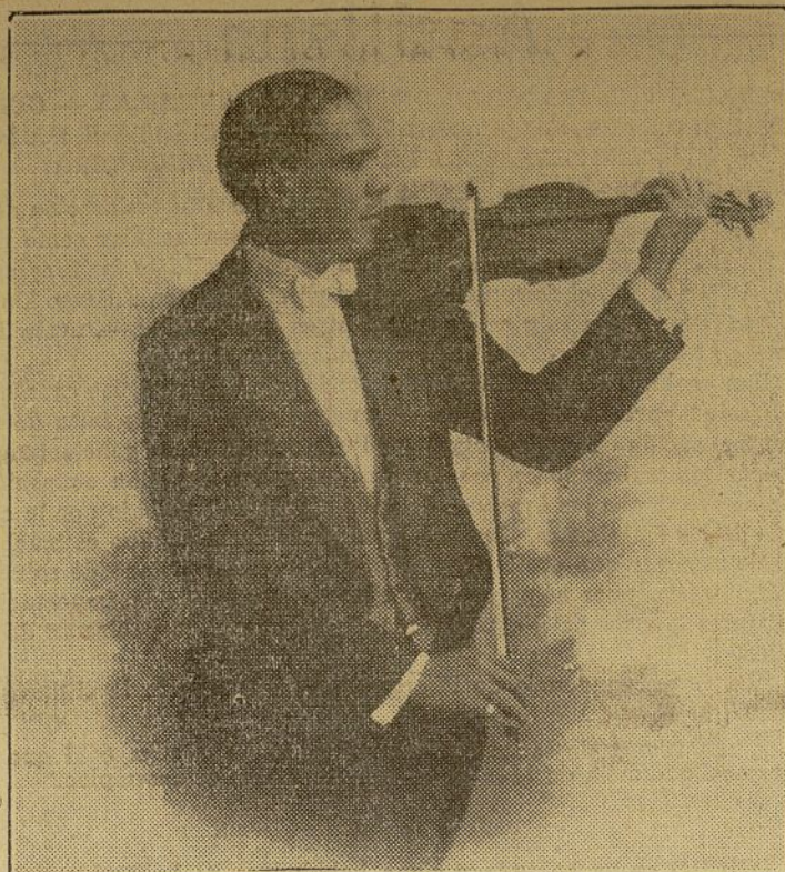
En la Academia de Música de Brooklyn, Avenida Lafayette y Astland Place, tendrá lugar el próximo sábado por la noche el anunciado recital del notable violinista cubano Luis Carlos Varona, a base de muy atractivo programa.