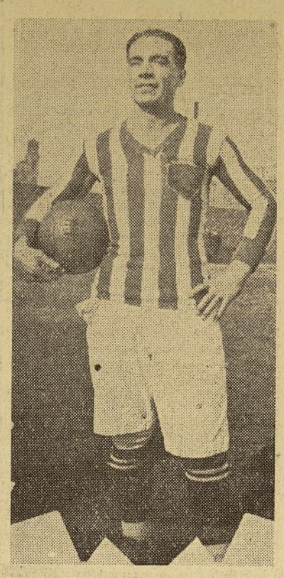
Hamabiet, capitán chileno.

La Comisión Atlética, para poder facilitar a los simpatizadores del equipo la oportunidad de presenciar este encuentro, pondrá a su disposición dos buses que partirán del club a las 12 meridianas. Todos los fanáticos que deseen acompañar al equipo, pueden reservar sus pasaje.