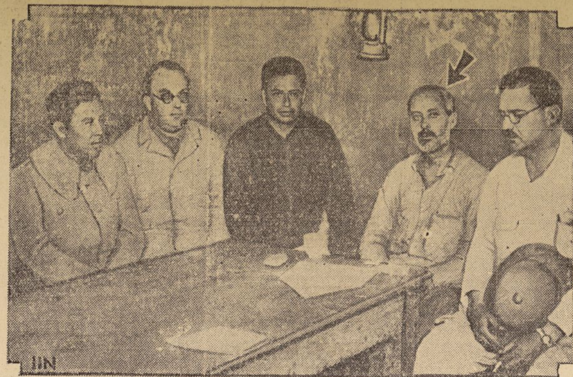
Esta extraordinaria fotografía fué tomada durante el proceso que se levantó contra el general Jesús M. Aguirre (flecha), acusado de dirigir el movimiento revolucionario contra el gobierno legal mejicano. Al día siguiente de haber aparecido ante el tribunal militar que lo juzga, el general Aguirre fué fusilado.