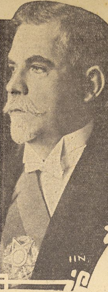
Washington Luis, Presidente del Brasil