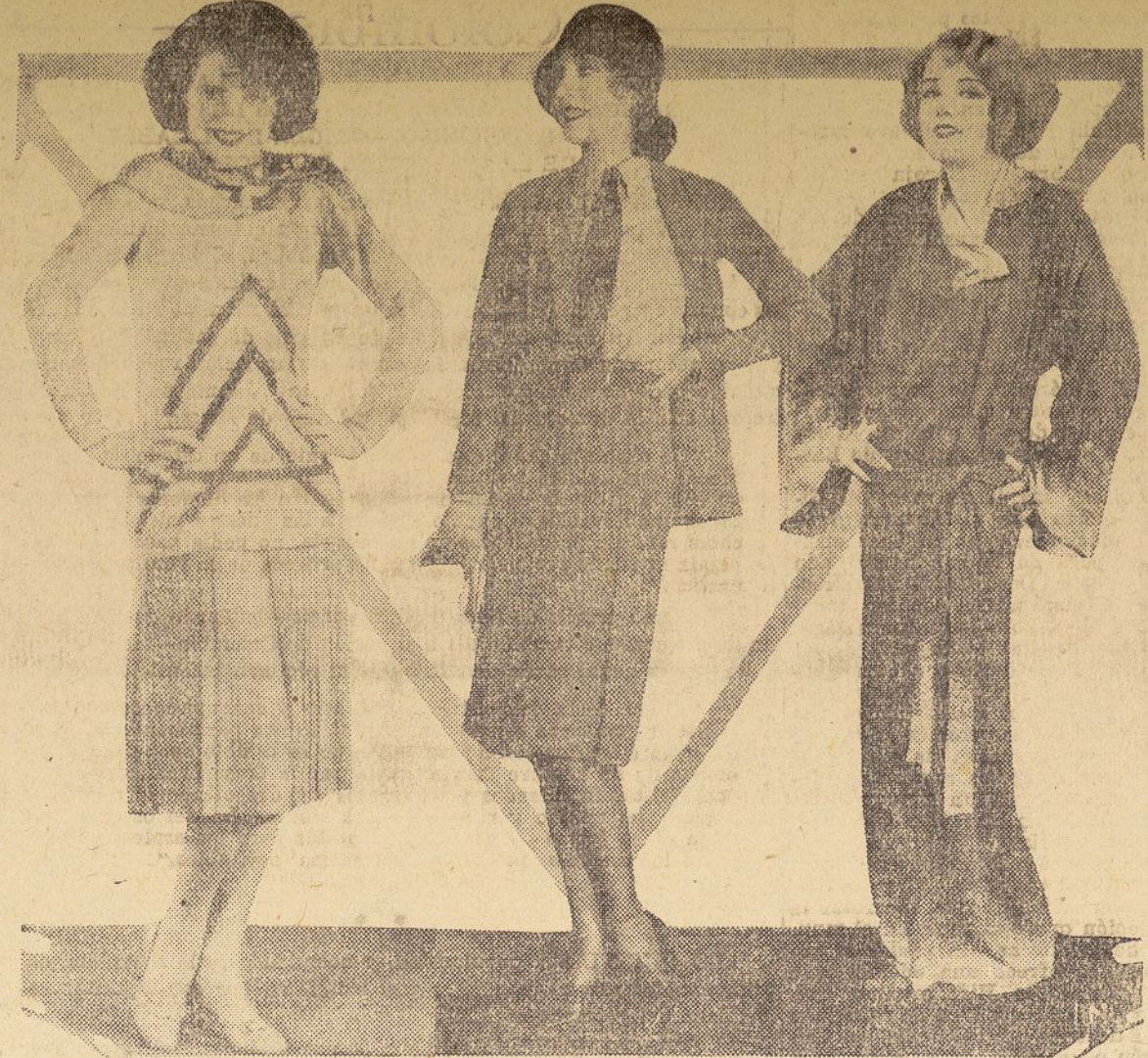
Uno de los modelos es muy apropiado para en las primeras horas de la mañana, para ser usado en casa; el del otro extremo es un admirable traje muy adecuado para eventos deportivos y, finalmente, el del centro es un traje estilo inglés, muy adecuado para paseos de tarde.