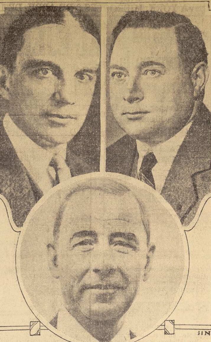
Owen D. Young, izquierda; David Sarnoff, derecha, y Thomas W. Lamont, abajo, han firmado, según noticias, en París un acuerdo por medio del cual se han unido la Radio Corporation of America con la International Telephone and Telegraph Company, formando el sistema de comunicaciones más extenso y poderoso que se conoce.