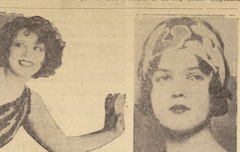
Cara Bow, la actriz de la magnética personalidad, sigue cautivando corazones esta semana en el "Rialto" como protagonista de "The Wild Party", interesante historia de impetuosa vida juvenil.

Nos hallamos sin duda en lo que bien pudiéramos denominar "La semana de la mujer." Toda cinta, hablada o muda, que se exhibe al presente, es dominada por alguna estrella del sexo femenino. Marie Prevost, una de las más admirables bellezas desarrolladas por el cine-