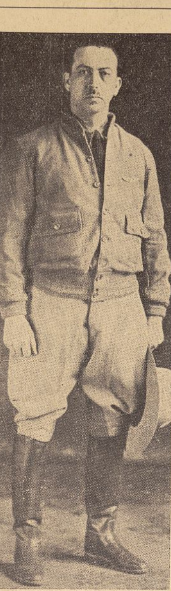
El general Gustavo Salinas, jefe de las fuerzas aéreas de las tropas rebeldes mejicanas que operan a las órdenes del general Escobar.