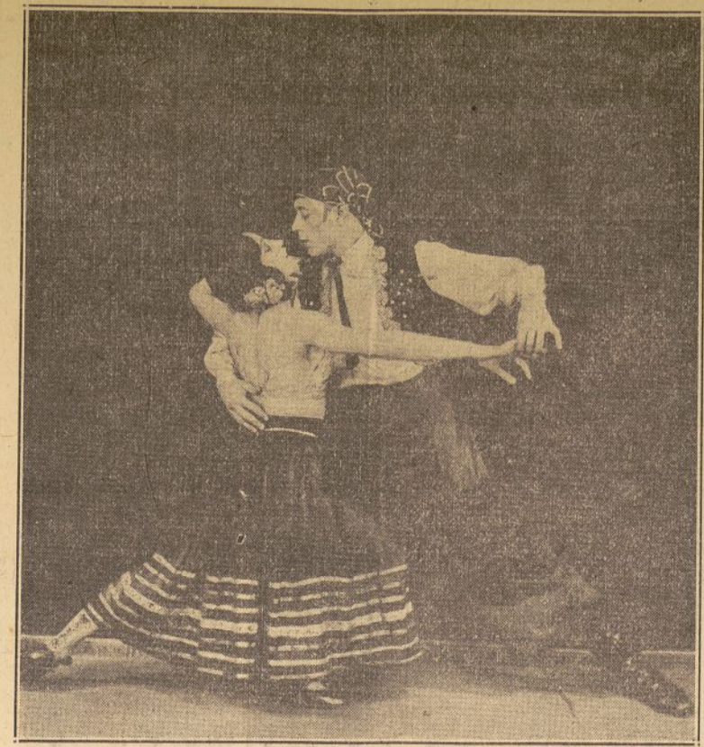
Aplaudida pareja de bailes que ha actuado en diferentes teatros y tomará parte en el programa del Park Palace.