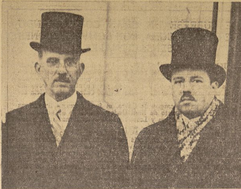
Doctor Juan Bautista Sacasa, nuevo ministro de Nicaragua en Washington (a la izquierda) y Mr. Francis White, subsecretario de Estado (derecha) momentos después de presentar el primero sus credenciales al presidente Hoover en la Casa Blanca.