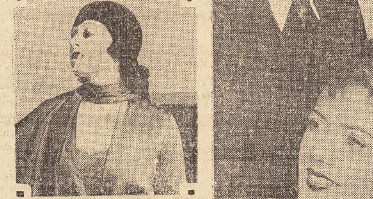
¿Sañica la sonrisa? Tendrá que ser así, no obstante, para tratar de la "sañica" en "Belasco".