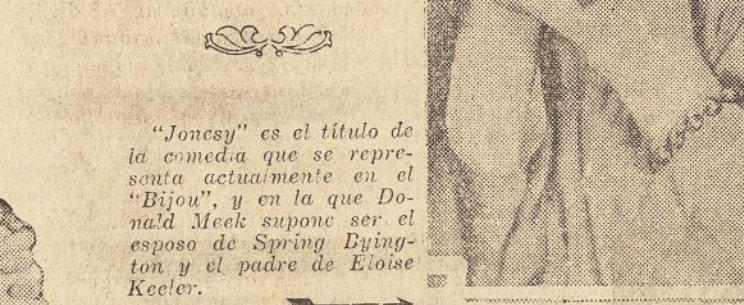
"Jonecy" es el título de la comedia que se representa actualmente en el "Bijou", y en la que Donald Meek supone ser el esposo de Spring Byington y el padre de Eloise Keeler.