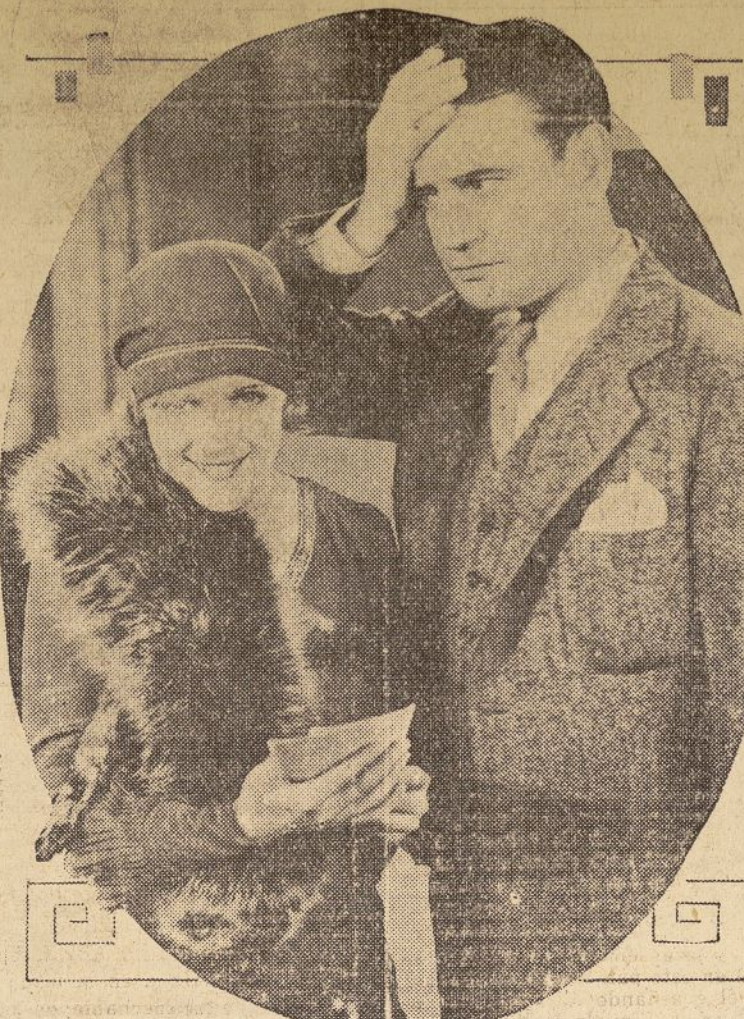
Cuando Dorothy Hall dijo semejante mentira, Richard Dix no pudo contener un ademán de asombro y espanto, mientras ella, por debajo del sombrero, sonreía triunfante. Se trata de "Nothing But the Truth", en el "Paramount".

MARK STRAND. Según la 4.ª línea semanal a precios populares. DIGA a RICHARD BARTHELMES. Hablar y Cantar en "WEARY RIVER".