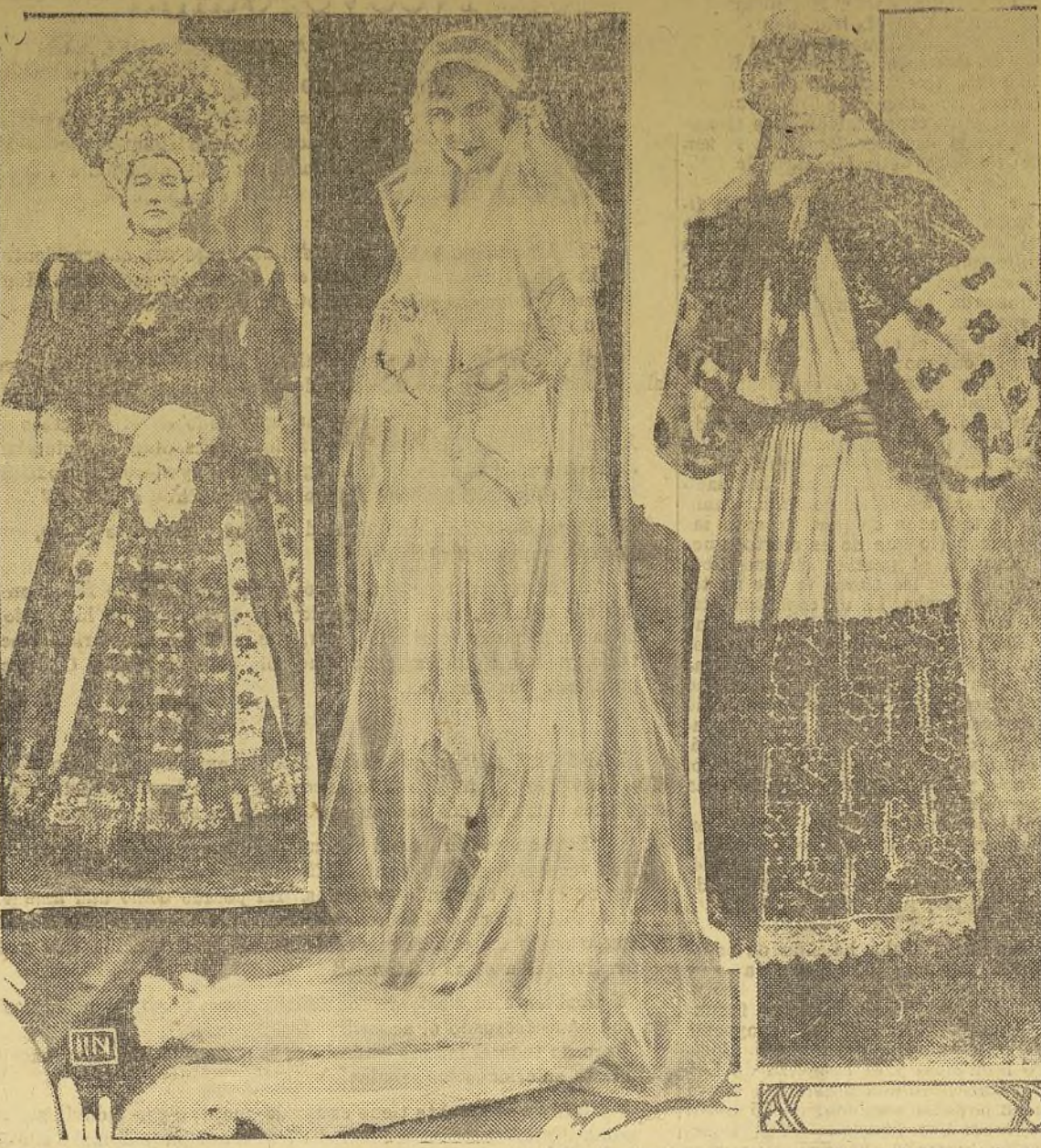
Esta fotografía ofrece tres admirables contrastes: sobre la influencia de la moda moderna y el peso de la tradición. Las tres ilustraciones ofrecen otros tantos contrastes de moda, muy populares entre la alta sociedad de tres países distintos. La primera fotografía de la izquierda es de una joven húngara en el momento de contraer matrimonio; la del centro es una joven norteamericana a "la última moda," y la de la derecha de una joven croata.