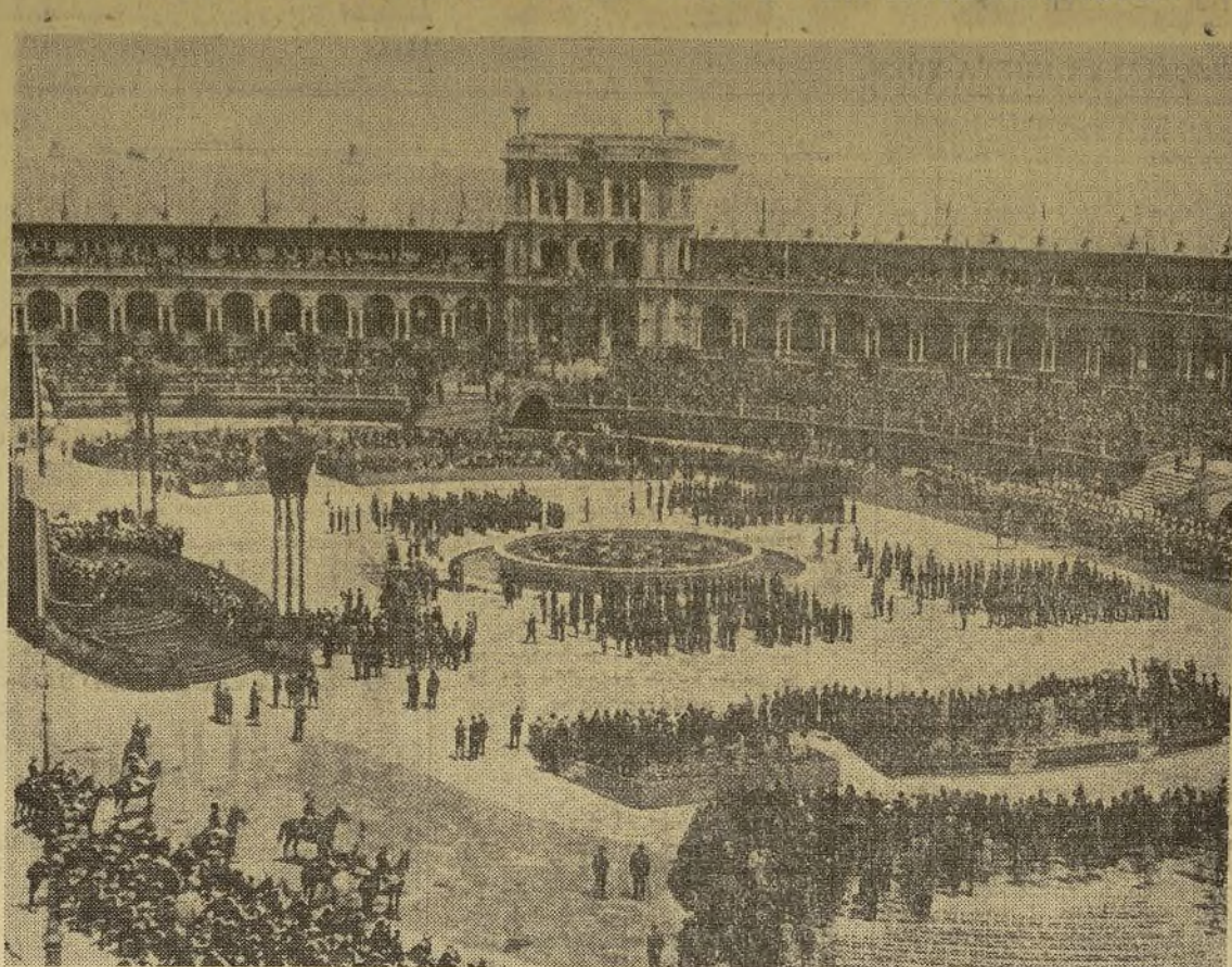
Esta fotografía da sólo una idea vaga del imponente aspecto que ofrecía la enorme Plaza de España el día de la inauguración de la Exposición Ibero Americana de Sevilla. Pueden también observarse dos de los numerosos enormes aparatos altavoces que fueron colocados para transmitir a todo el recinto los discursos y demás detalles de la ceremonia de inauguración.