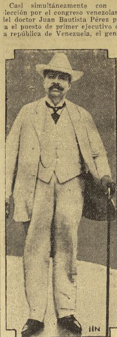
General Juan Vicente Gómez

El cuerpo diplomático, los dignatarios de la iglesia y los miembros del gabinete asistieron a la toma de posesión