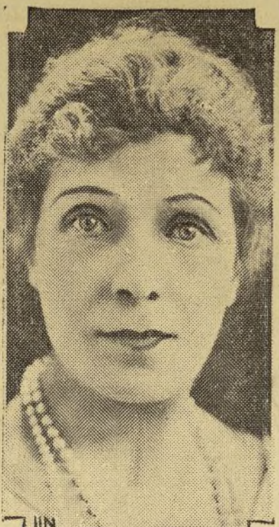
La infanta Eulalia