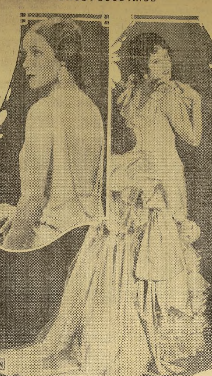
Especially para ocasiones especiales está ganando un impulso enorme la idea de usar vestidos que dejen completamente al descubierto a espaldas. La idea tuvo su origen hace algunos años, como puede verse en la figura de la derecha la que ofrece nada menos que a la bella Dolores del Río en los momentos de ponerse uno de los "últimos modelos" de París, imitando a las mujeres de hace cincuenta años.