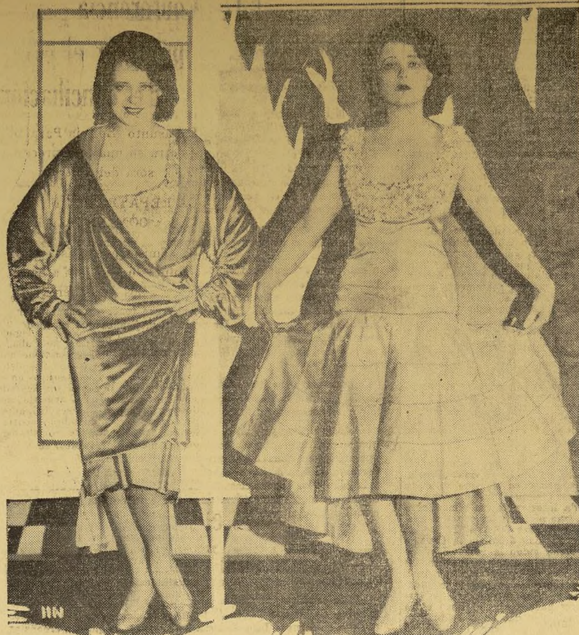
Hace algunos años era cosa bastante frecuente el ver modelos de vestidos con una cola enorme. Hoy, haciendo justicia a aquello de que, "la historia se repite", la cola vuelve, pero modificada.