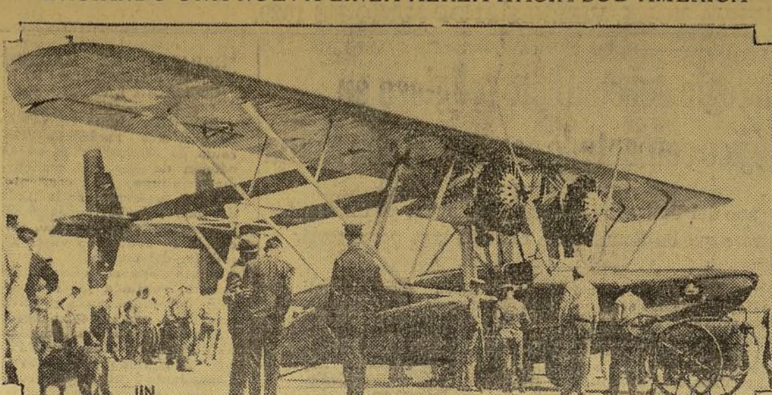
El gran hidroavión Sikorsky "Washington" se encuentra hacia Buenos Aires, dispuesto a inaugurar el nuevo servicio aéreo de correos y pasajeros entre New York y aquella capital. En dos ocasiones durante su actual vuelo por las Antillas ha sufrido algunas averías, pero se confía en que continuará felizmente hacia el sur por el resto de la travesía.