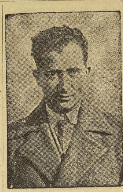
Comandante Ramón Franco

Gallarza fué el héroe del vuelo desde España a las islas Filipinas