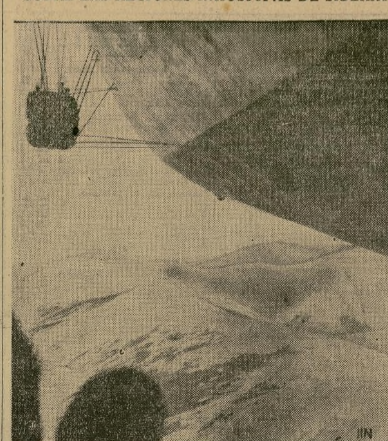
Impresionante fotografía tomada desde una de las góndolas traseras del "Graf Zeppelin" durante la travesía de las montañas Stanowoi, Siberia. La cámara del arriesgado operador ha sorprendido escenas que hasta hoy habían permanecido vírgenes frente al lente del objetivo.