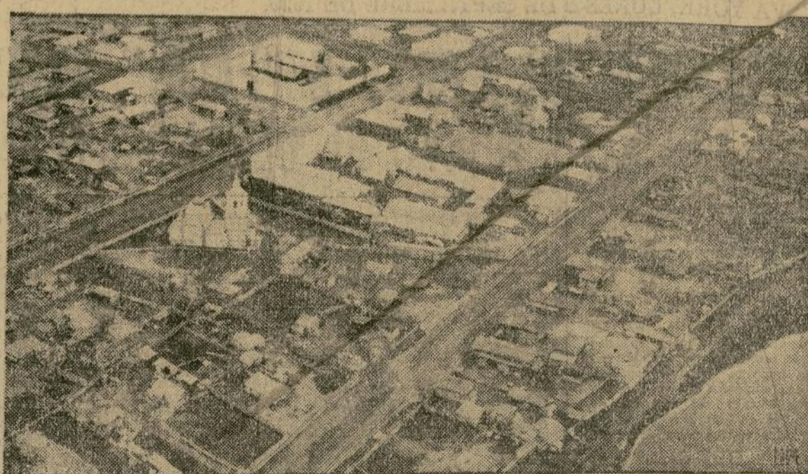
Lo ha sido, sin duda, la silueta del “Graf Zeppelin” al pasar por algunas localidades de Siberia. La presente fotografía, tomada al cruzar Jakutsk, ofrece el panorama de una población siberiana. Según manifestaron los viajeros del “Graf Zeppelin”, los habitantes de Jakutsk, al divisar el gigantesco dirigible, corrieron a sus casas dominados por el pánico.