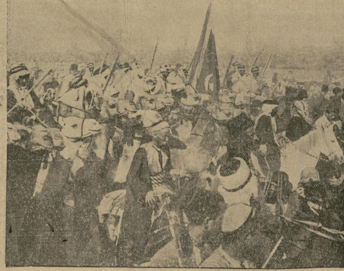
Numerosos contingentes de árabes procedentes de Siria amenazan unirse con sus hermanos de Palestina. Esta fotografía sorprende una reunión en pleno desierto de diferentes tribus. Obsérvese la bandera mahometana emergiendo del agitado grupo de árabes montados en sus briosos azaanes.

LOS ARABES, EN NUCLEOS IMPORTANTES, PERSISTEN EN SU ACTITUD REBELDE