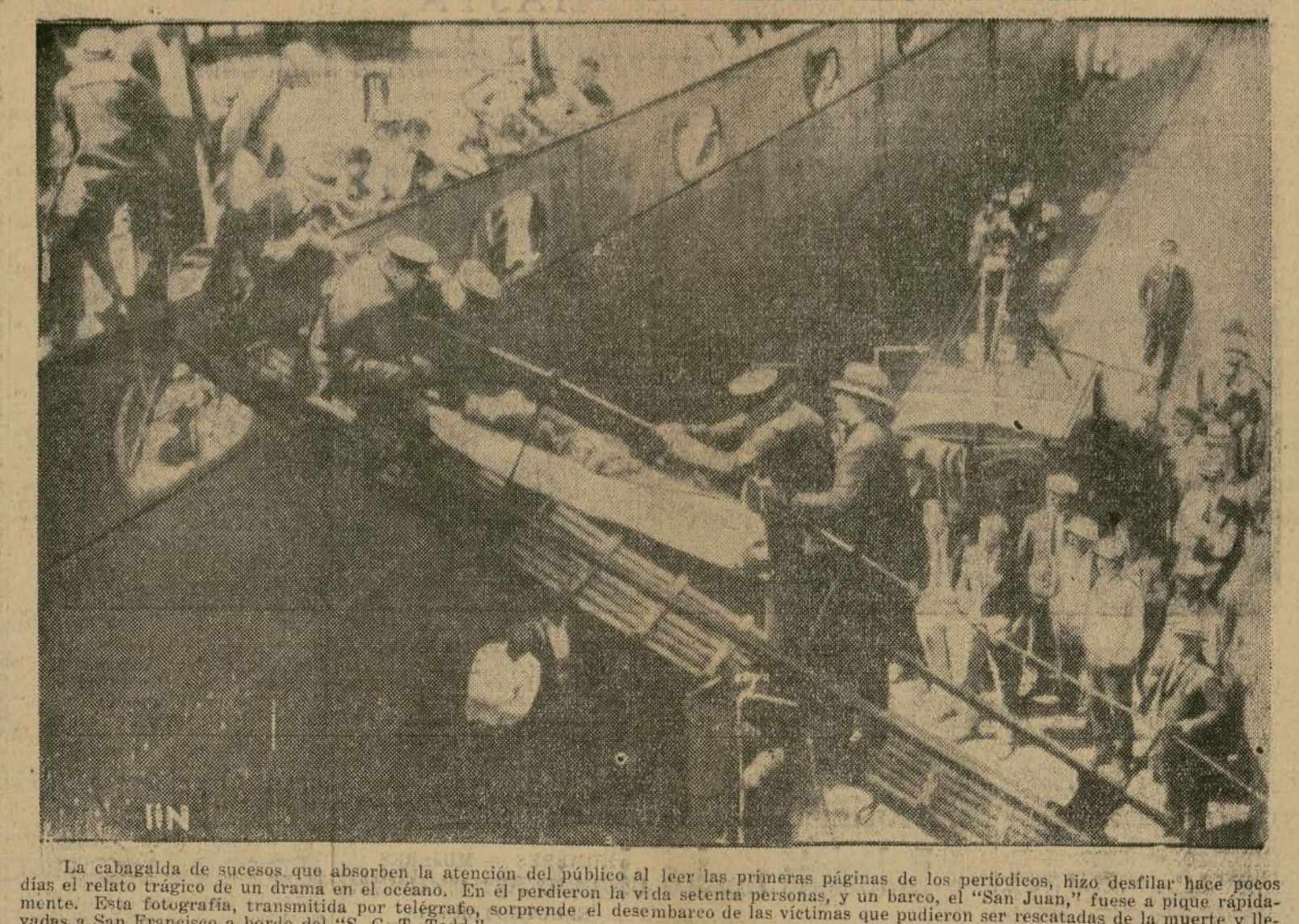
La cabalgata de sucesos que absorben la atención del público al leer las primeras páginas de los periódicos, hizo desfilar hace pocos días el relato trágico de un drama en el océano. En el perdieron la vida setenta personas, y un barco, el "San Juan", fue a pique rápidamente a San Francisco a bordo del "S. C. T. Todd".