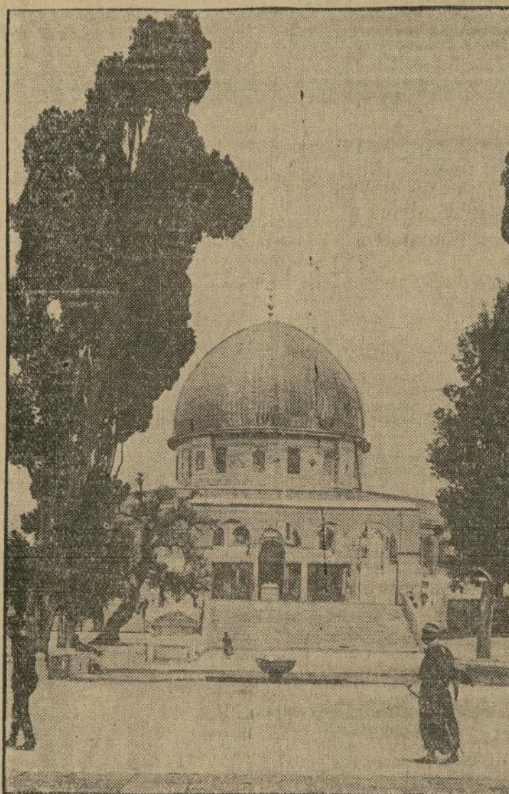
Aunque prevalece la intranquilidad y quedan aún posibles asomos de nuevos disturbios, Jerusalén la ciudad sagrada, cobija de leyendas y basamento de los mil evocadores relatos bíblicos, vuelve a recibir su característico aspecto soportado de cosas venidas en el calendario de la vida.