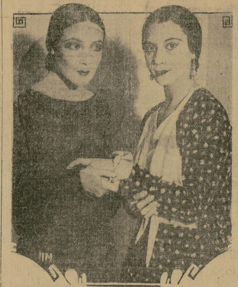
Miss Helen E. Raften, ha sido escogida como la muchacha cuyo parecido físico es el más aproximado a la notable artista mejicana. En esta fotografía, aparece Dolores del Río—ofreciendo a su "doble" también un contrato para filmar.