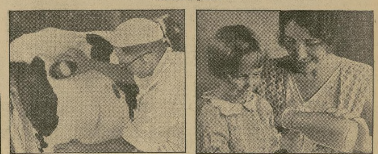
Los flancos y ubres son cuidadosamente lavados antes de ordeñar. Los ordeñadores usan trajes blancos muy limpios y se lavan las manos antes de ir de una vaca a otra.