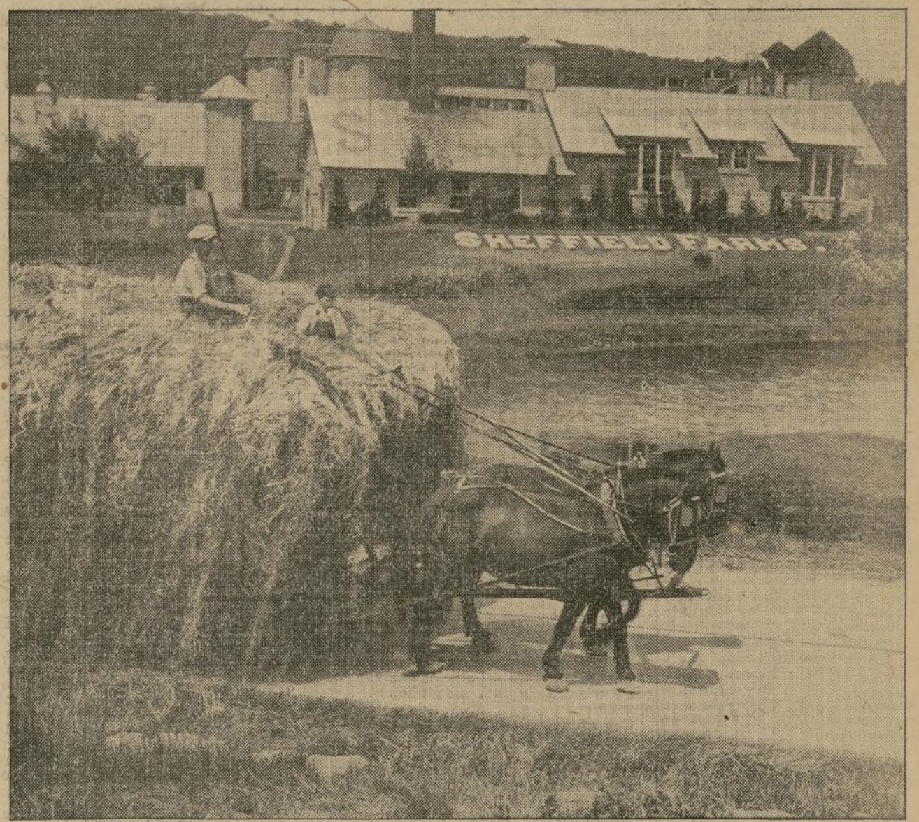
Una pintoresca vista de la Granja Sheffield Certificada en Pawling, N. Y., con un carretón de heno para ser conducido al granero

Día tras día, domingos y fiestas—miles de las botellas Sheffield son servidas en los hogares de la ciudad de Nueva York. El lechero tiene su día festivo, pero la leche es suministrada tan regularmente como las mareas. Los repartidores Sheffield son enseñados a ser corteses, limpios, dignos de confianza y honrados.