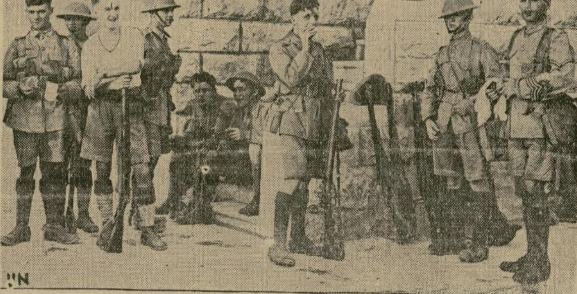
Entre las unidades de infantería que Inglaterra ha transportado a Palestina, figura un batallón de los famosos South Wales Borderers. Un destacamento ocupa el pueblo de Talpith, lugar donde fué tomada esta fotografía.

La forma de Victorio mejora a medida que se aproxima más el encuentro y no hay duda de que sus "work-outs" de mañana y pasado, que serán los finales, lo mostrarán en el apogeo de su estado de preparación.