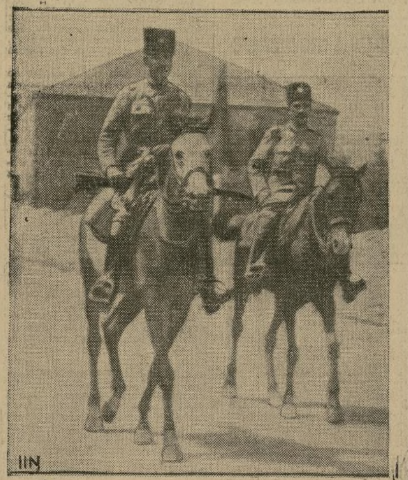
Una pareja de la policía montada circulando por las calles de Jerusalén, después de haberse iniciado la pacificación de los ánimos.