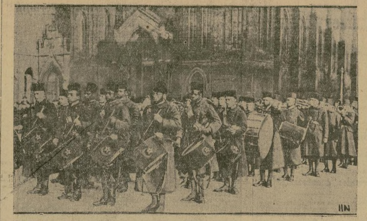
Entre los núcleos que integran el ejército de ocupación francés en la zona del Rin figuran varios regimientos marroquíes, los cuales, según informaciones circuladas, no complacen a la población civil, que teme que sigan destacados durante todo el año próximo.