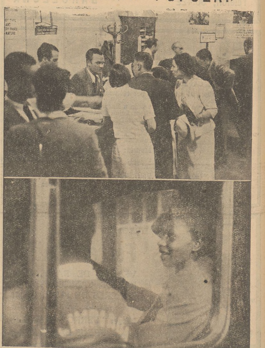
L'Olimpiada Popular marxa. Gran activitat, l'activitat que precedeix tota gran organització. A les oficines d'allotjaments, l'afluència d'estrangers és enorme i els equips participants comencen a arribar d'arreu del món. Ahir arribaren els atletes nordamericans, entre els quals una atleta negra, que és una excel·lent corredora de 100 metres. Vagueu-la a l'interior del cotxe en arribar a la nostra ciutat

Llegiu avui i cada dia LA HUMANITAT, el vostre diari