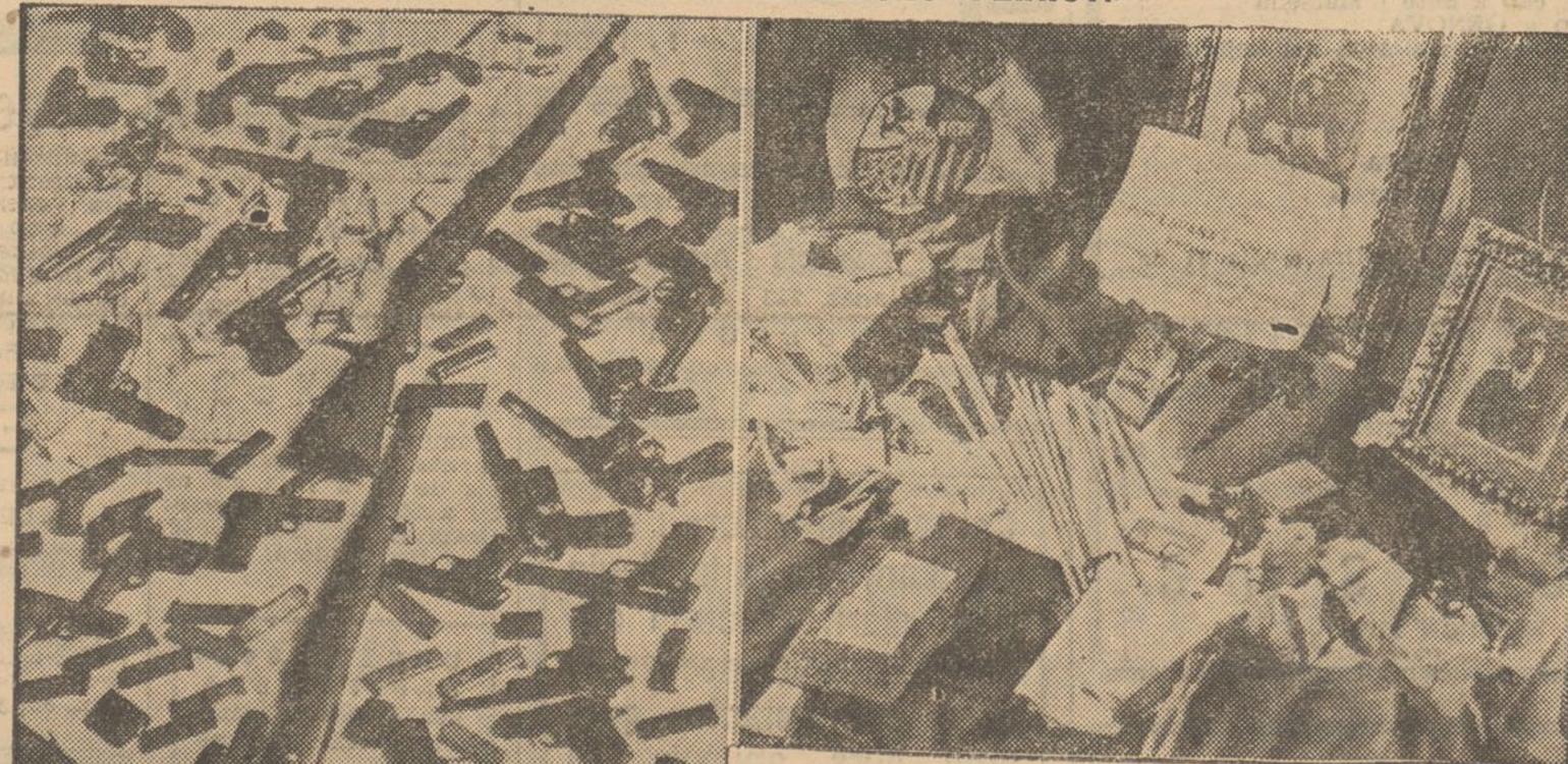
La policia ha practicat aquests dies, excel·lents serveis de registre en locals ocupats pels feixistes. Heus aquí una recollida d'armes en un dels esmentats locals i retrats del Borbó, documents i ensenyes trobats en centres de la gent d'ordre (Centelles)