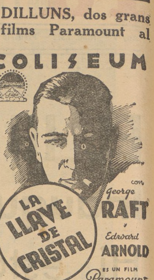
La més emotiva i dinàmica de les pel·lícules de gangsters i el formidable còmic