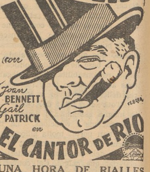
UNA HORA DE RIALLES