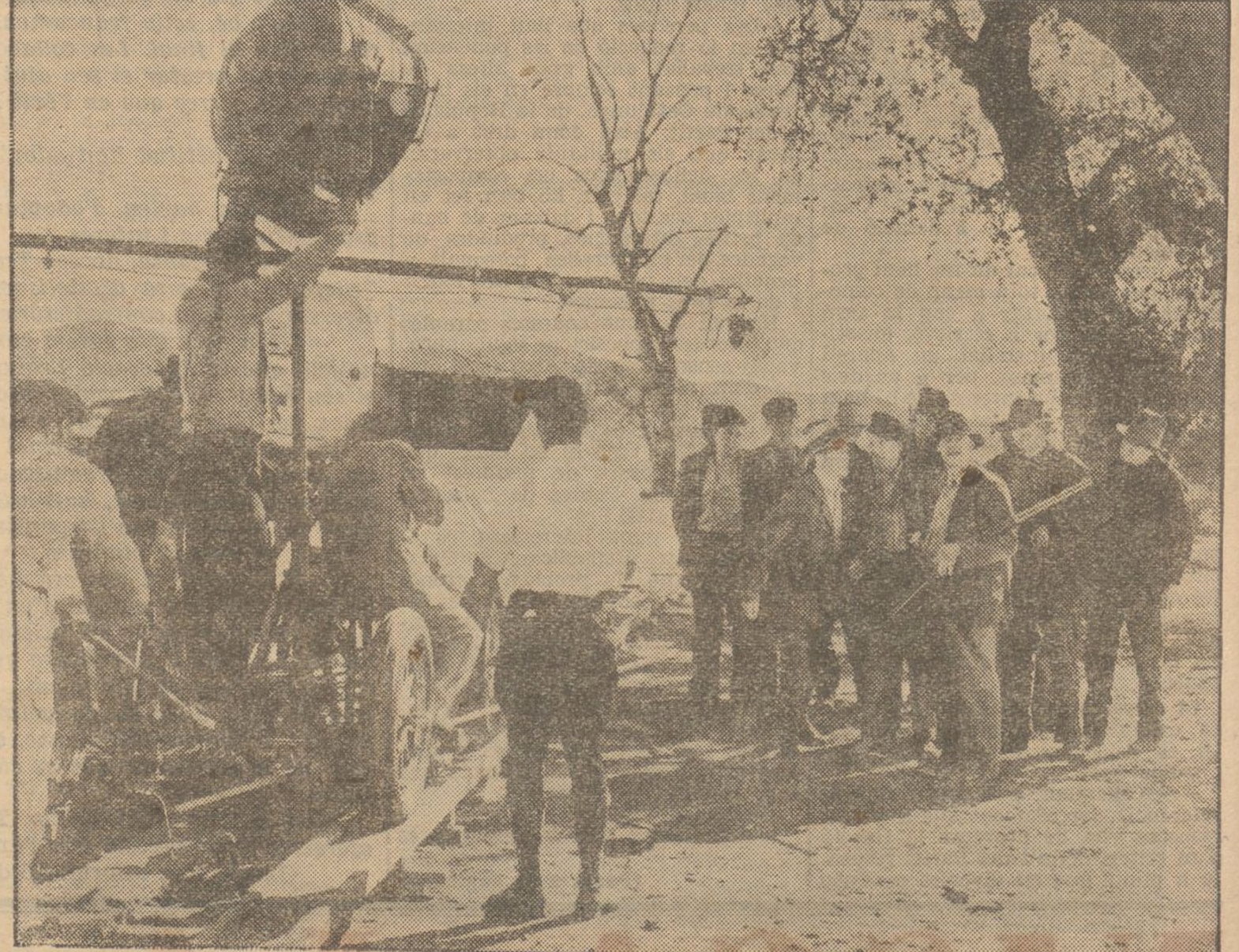
Richard Thorpe, per compte de la M-G-M., dirigeix aquesta escena de la pel·lícula «The voice of Bugle Ann», els protagonistes de la qual són: Lionel Barrymore i Eric Linden. L'assumpte té, per fons, una dramàtica història que es desenrotlla a les riberes del Missouri

Catalanista i republicà: el teu diari és LA HUMANITAT