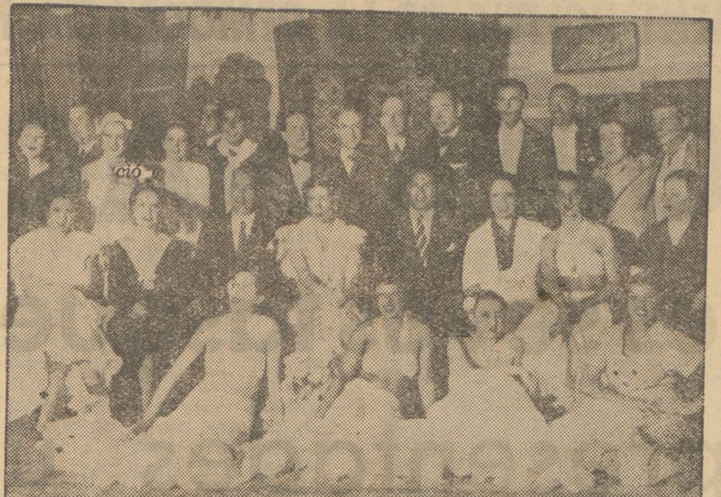
Grup d'artistes que varen prendre part en el festival a honor dels aviadors filipins, Arnaiz i Calvo, celebrat amb gran èxit al teatre Chueca, de Madrid

Convocatòria L'Associació de Crítics Teatral i Musicals de la Premsa Diària de Barcelona celebrarà demà, diumenge, dia 19, a les dotze de primera convocatòria, i a dos quarts d'una de segona, Junta general extraordinària de socis per tal d'acomplir l'article 10 dels Estatuts. La reunió tindrà lloc al saló d'actes de l'Associació de la Premsa Diària (Canuda, 13).