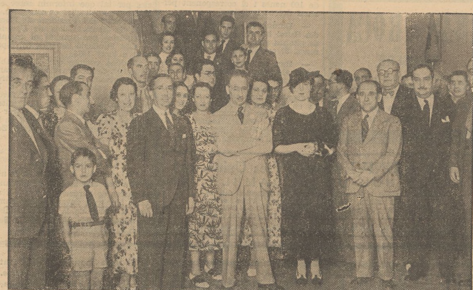
S'inaugurà ahir, divendres, amb assistència del President de la Generalitat i del Conseller de Sanitat, el servei de la «Lluita Antivènèria» en el magnífic edifici que ocupa la Conselleria de Sanitat al Passeig de Fermí Galan.