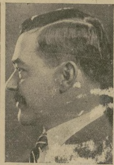
Doctor V. Mejía Colindres

Congreso del clero. (P.)—TEGUCIGALPA, septiembre 30. (P.)—El arzobispo de Honduras, (Sigue en la 2a. pág.)