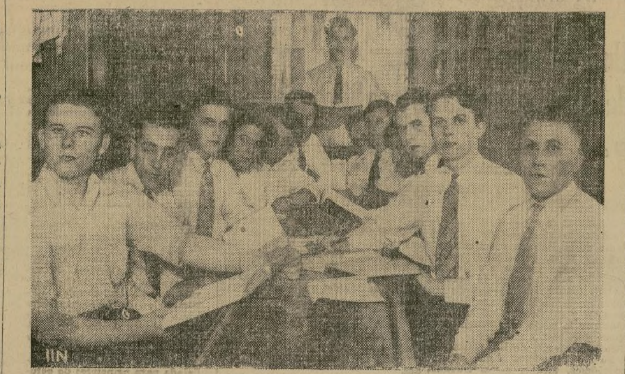
Trece miembros de la National Textile Workers Union de Gastonia, N. C., se encuentran en el edificio correccional de Charlotte, N. C., pendiente del juicio que se sigue por la muerte del jefe de policía de Gastonia, ocurrida durante el disturbio registrado a raíz de la huelga textil. Mientras esperan el fallo que ha de decidir sobre su futuro, y como puede verse en esta fotografía, los presuntos culpables se dedican a estudiar las teorías sociológicas contemporáneas.