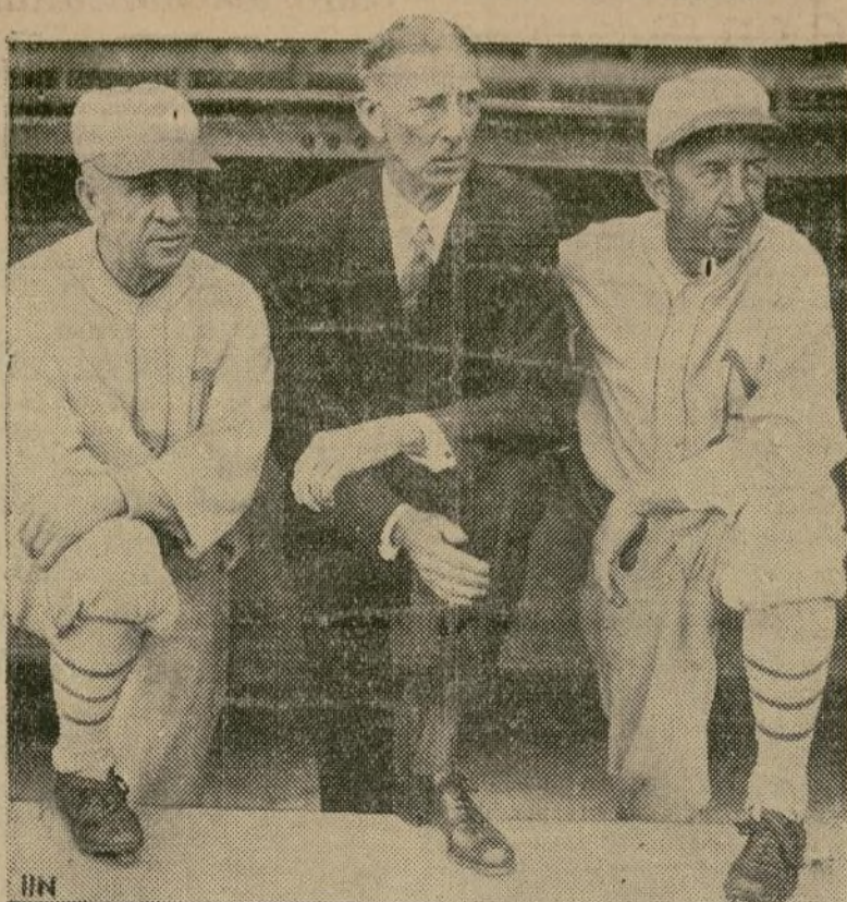
De izquierda a derecha, "Kid" Gleason, "coach"; Connie Mack, "manager"; y Eddie Collins, "coach", quienes forman el estado mayor de la Liga Americana. Ellos producirán la estrategia que tendrán que vencer los "cuus" para ganar el campeonato mundial.