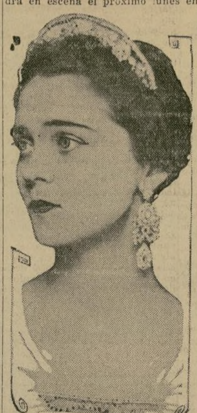
Eva Le Gallienne

Miss Eva Le Gallienne, después de invadir esta temporada los campos dramáticos ruso y español, pondrá en escena el próximo lunes en