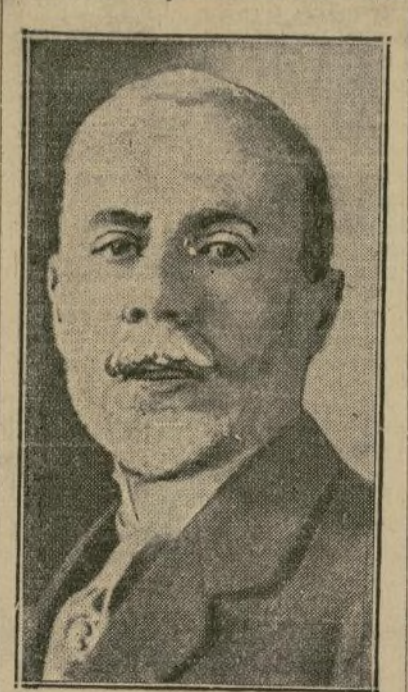
General Arcadio de Oscar Frago, presidente de Portugal