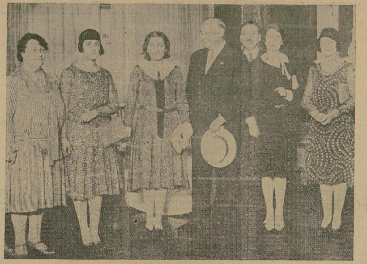
Edna Mussolini, hija de Benito Mussolini, presidente del consejo de ministros de Italia, recibió constantes atenciones durante su permanencia en España. Aquí la vemos en compañía del general Primo de Rivera, las dos hijas de éste, las señoritas Carmen y Pilar Primo de Rivera, en su residencia particular.