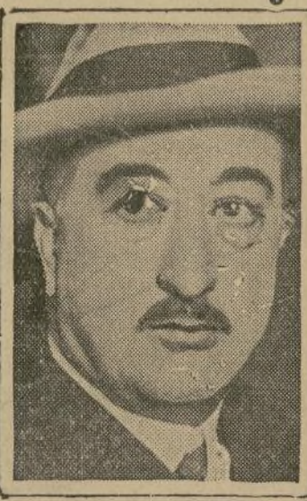
Doctor Orestes Ferrara

"Si el congreso de los Estados Unidos eleva la actual tarifa arancelaria que pesa sobre nuestro azúcar, la ruina de Cuba será completa", dijo ayer el señor Orestes Ferrara, embajador de Cuba en Washington, D. C., a su llegada procedente de Europa, acompañado de su distinguida esposa. "Es mi opinión—añadió—que los Estados Unidos no perderán nada al reducir la tarifa aduanera entre ellos, harían mucho mejor para su interés recíproco, anular todos los derechos y establecer libre comercio. La política del gobierno cubano está basada en el siguiente principio: "Independencia política y unión comercial con los Estados Unidos."