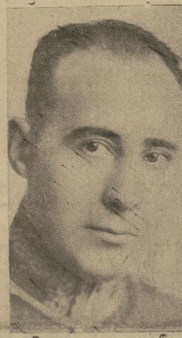
Don Luis Palazuelo, cónsul de España