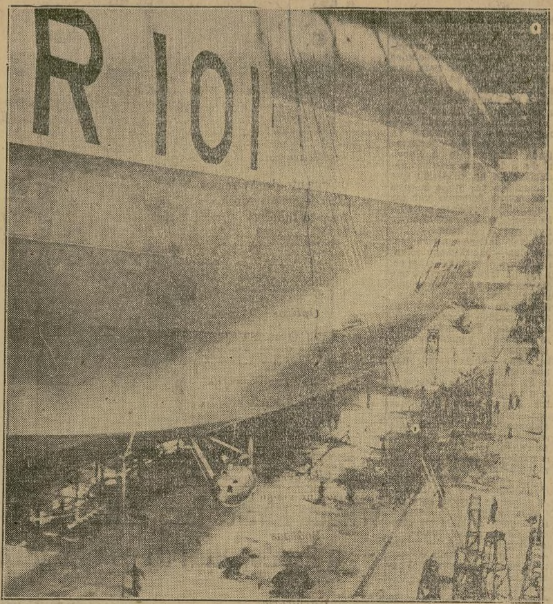
El gigantesco dirigible inglés R-101 en los vuelos de prueba a que se le ha sometido hace pocos días, ha probado que los rumores que habían circulado diciendo que no reunía condiciones eran infundados. Créase que a no tardar la nueva aeronave aprenderá un viaje a los Estados Unidos.