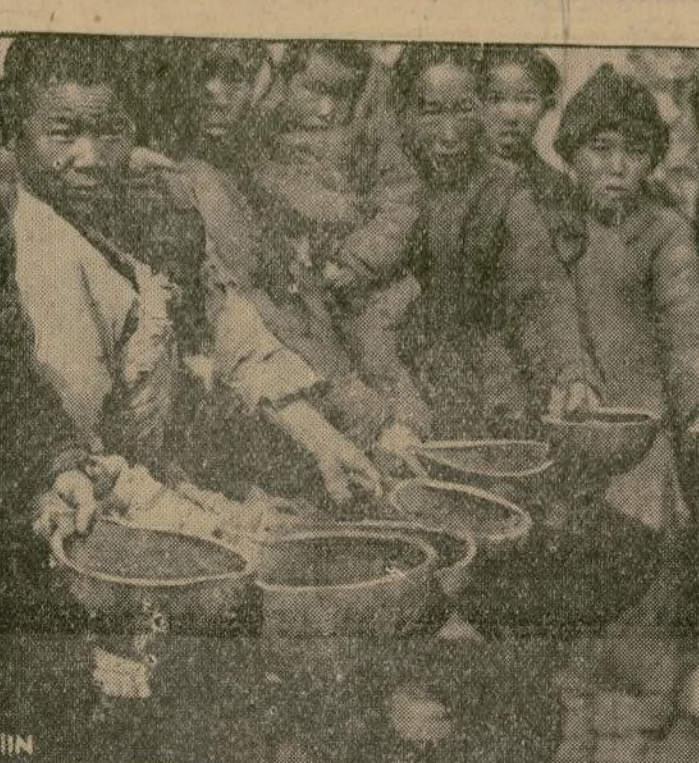
Mientras las fuerzas del gobierno y las de los revolucionarios pelean por la supremacía el pueblo padece de hambre. En algunas secciones del país la situación es crítica y en algunos puntos, según informes, los pobres se han visto obligados a rematar a sus hijos para evitar sus sufrimientos. En esta fotografía puede verse a un grupo de chinos aguardando el turno para adquirir un poco de pan en Shanghai.